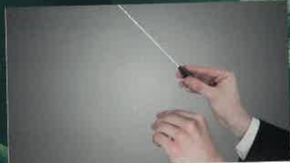
CHORALE "CHANTONS EN TERRES VIVES" p.20