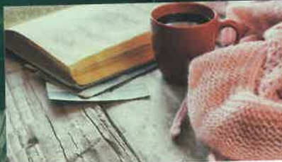
Café littéraire p.19