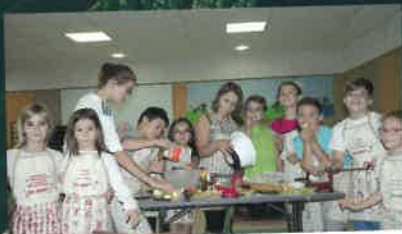
ATELIER DU MERCREDI p.20