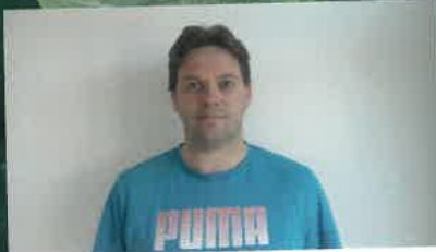
LE MOT DU PRÉSIDENT p.18