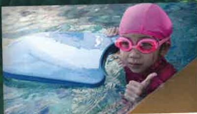
SECTION NATATION p.22