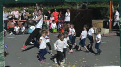
LES AMIS DE L'ÉCOLE p.21