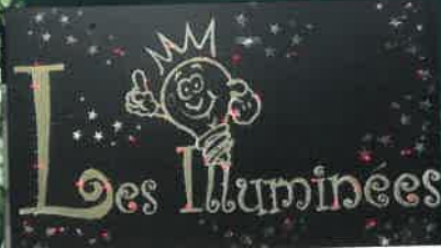
LES ILLUMINÉES p.23