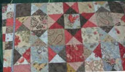
SECTION DE PATCHWORK p.21