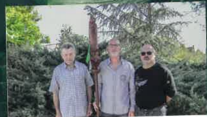
Amicale Vigneronne de la Saint-Vincent p.23