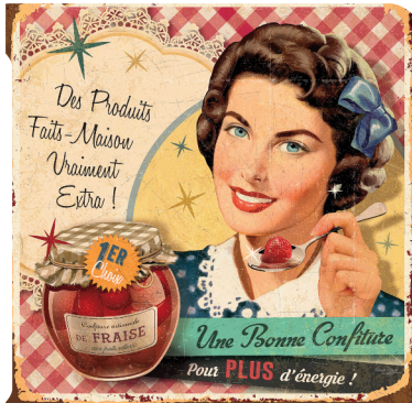
Des images porteuses d'histoire et d'émotions

Même le Covid n'a pas impacté trop fortement cette