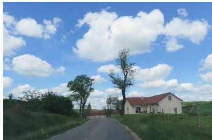
Une entrée de bourgs marquée par la présence de