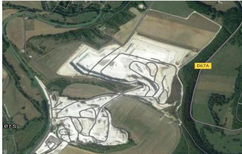
Carrière présente sur la commune de Donjeux