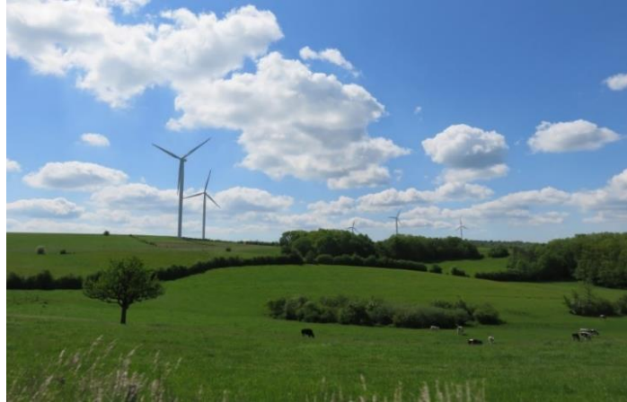
Eoliennes amplifiant la perception de la nature