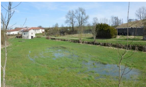
Les prairies humides, des habitats particuliers riches en biodiversité –