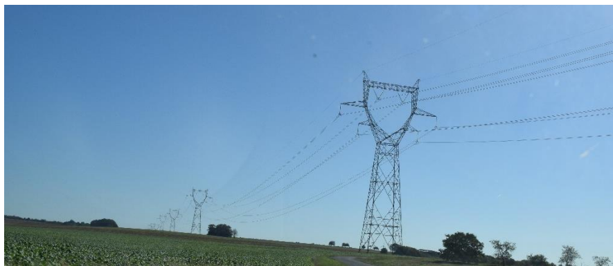
Lignes haute-tension sur le territoire : Source : Even-conseil