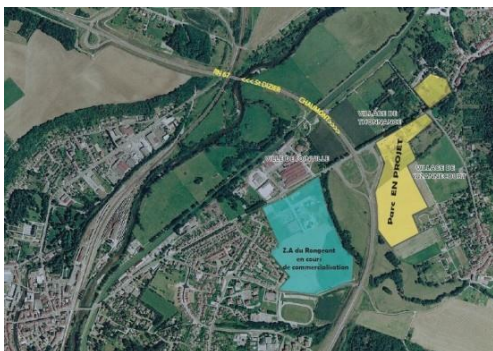
Les zones d'activités du Rongeaert et de la Joinchère