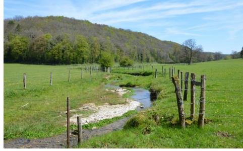
Des fonds de vallées occupés de prairies humides et de prés pâturés, support d'ambiances pittoresques et rurales