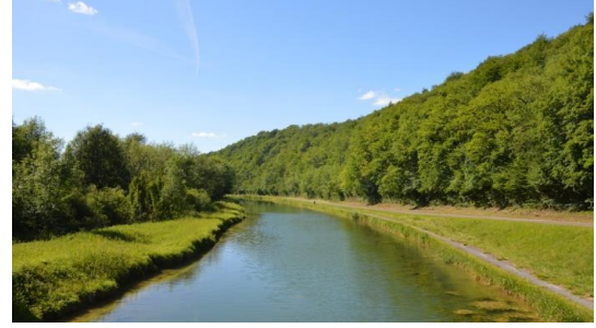
Le canal entre Champagne et Bourgogne à de Gudmont-Villiers à Chatonrupt-Sommermont, une manière alternative de découvrir la vallée de la Marne