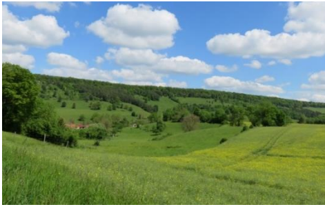
Des structures végétales arborées soulignant les reliefs, et créant des connexions entre coteaux boisés et fonds