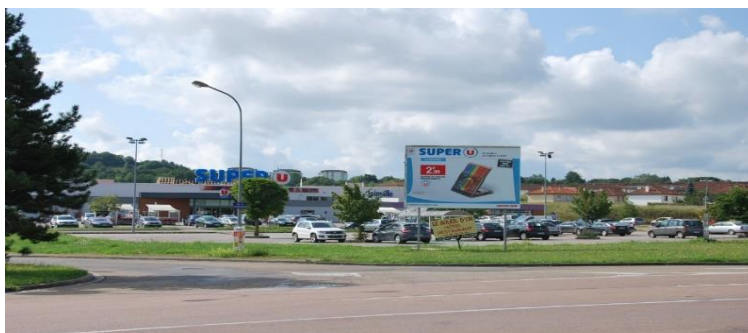
Zone commerciale végétalisée, s'intégrant davantage aux paysages alentours