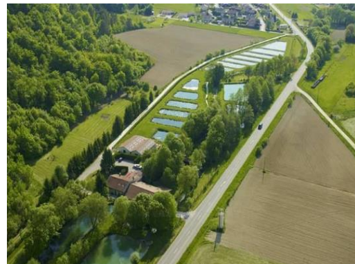
Le Moulin aux écrevisses, à Thonnance-lès-Joinville