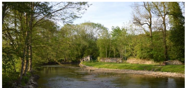
La Blaise, cours d'eau accompagné de ripisylve - Arnancourt