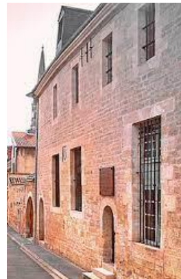
Auditoire de Joinville