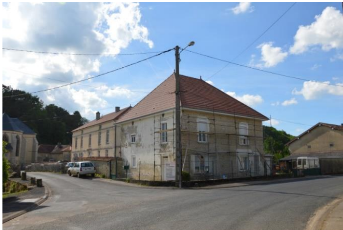
Exemple de réhabilitation en cours à Beurville