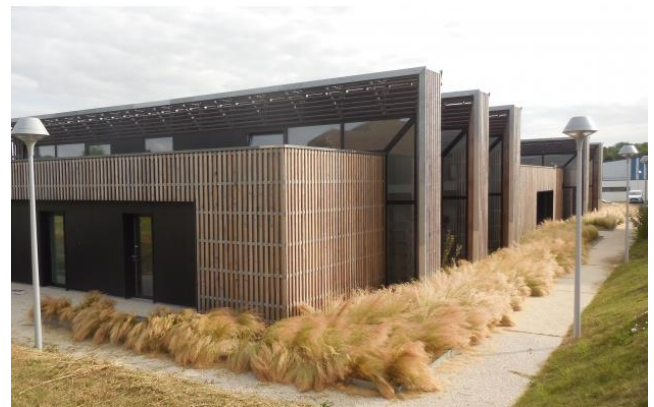
Maison de Santé bioclimatique et avec des matériaux naturels (label HQE) à Void-Vacon