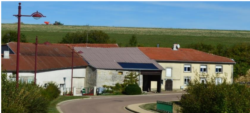
Dispositif de production d'énergie solaire installé sur un bâtiment de stockage agricole le long de la RD960 sur la commune de Saudron