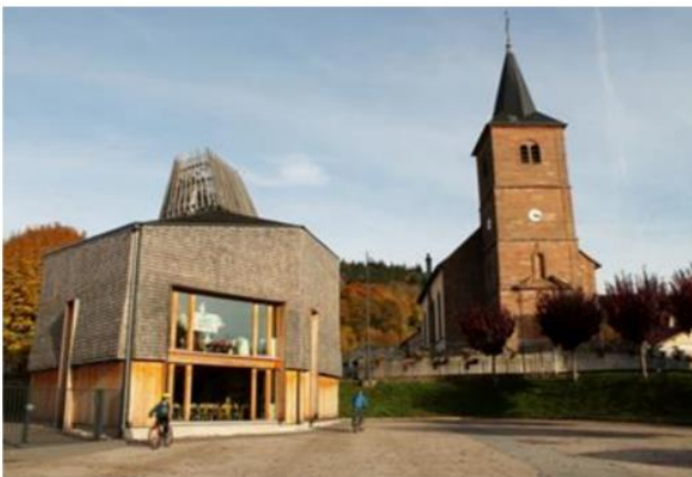
Bâtiment périscolaire à Tendon (88) utilisant des matériaux locaux et biosourcés (bois, paille...)