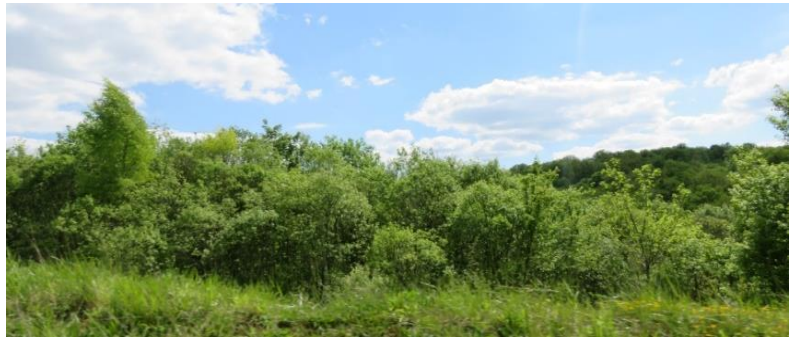
Espace relais des espaces agricoles