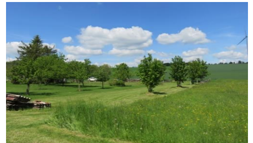
Exemples de transition qualitative entre espaces bâtis et milieux agricoles ouverts opérés par une