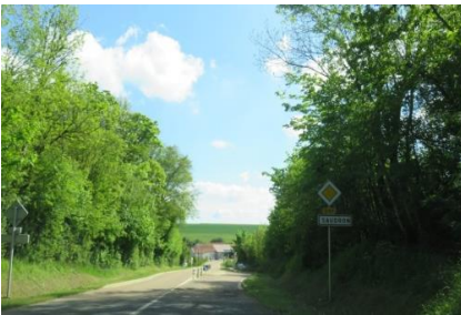
Une entrée de bourg relativement qualitative : présence de végétal, pas