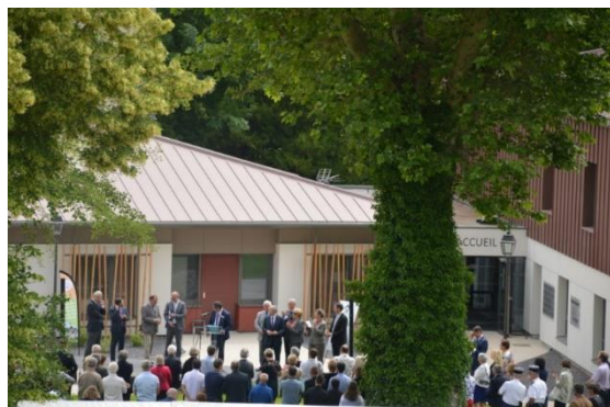
Inauguration de la maison de santé pluriprofessionnelle