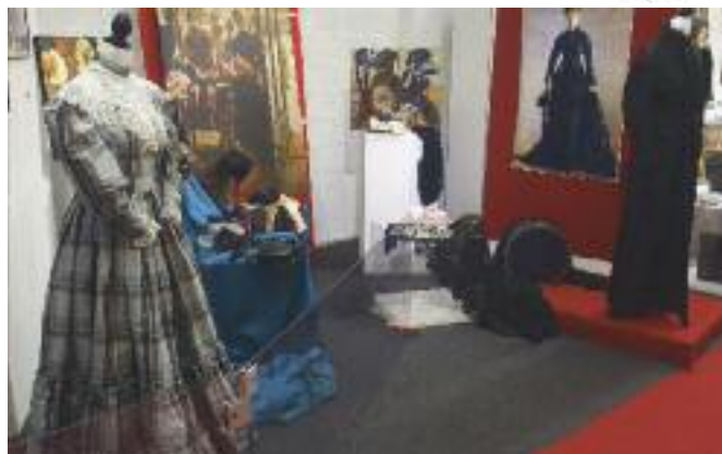
L'exposition Portraits Croisés établit des correspondances entre des tableaux célèbres, la vie à cette époque et le patrimoine local

Une telle organisation nécessite beaucoup de travail et de soutien et elle a été facilitée grâce aux membres du musée, des Amis du musée, de la municipalité et de ses divers services ainsi que du Conseil départemental.