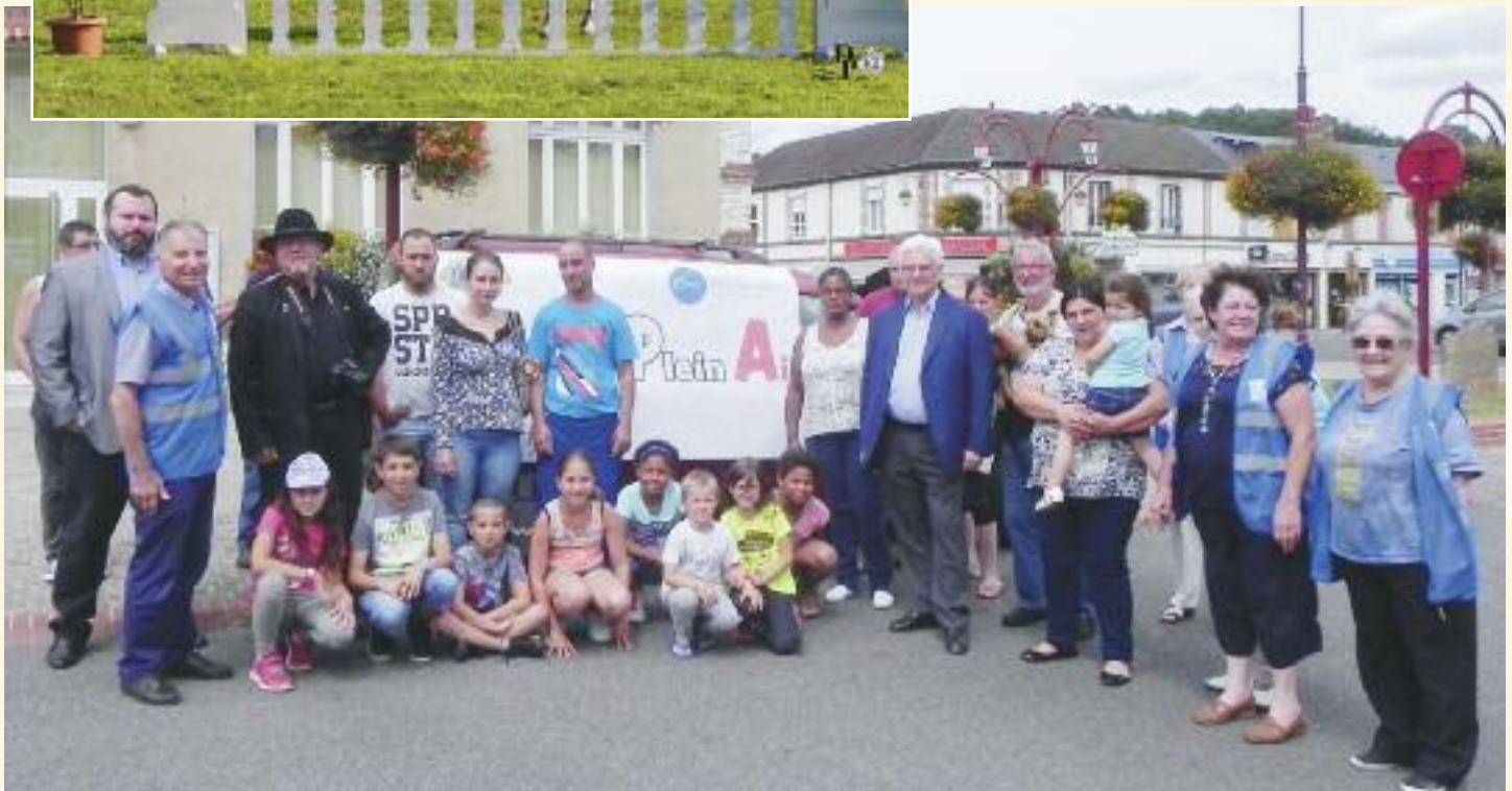
Vacances en plein air pour 10 enfants avec St Vincent de Paul et le Lion's Club