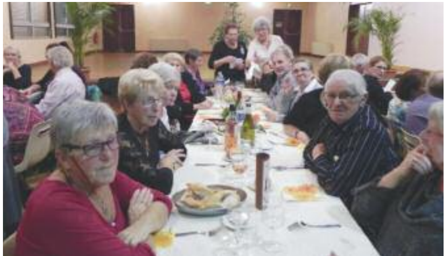
Les membres du bureau