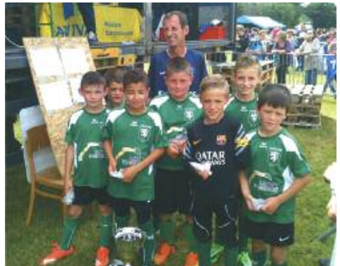
L'équipe U9 : vainqueur de 4 tournois et 2 défaites en finale

Nous avons une pensée pour Christophe Lerest, dirigeant du club qui nous a quitté des suites d'une maladie.