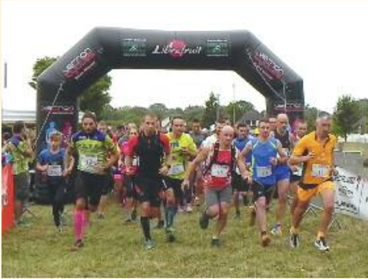
2 ème trail