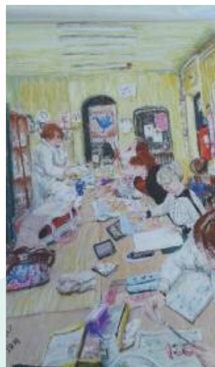
Un mercredi matin... (tableau réalisé par une artiste de l'association)