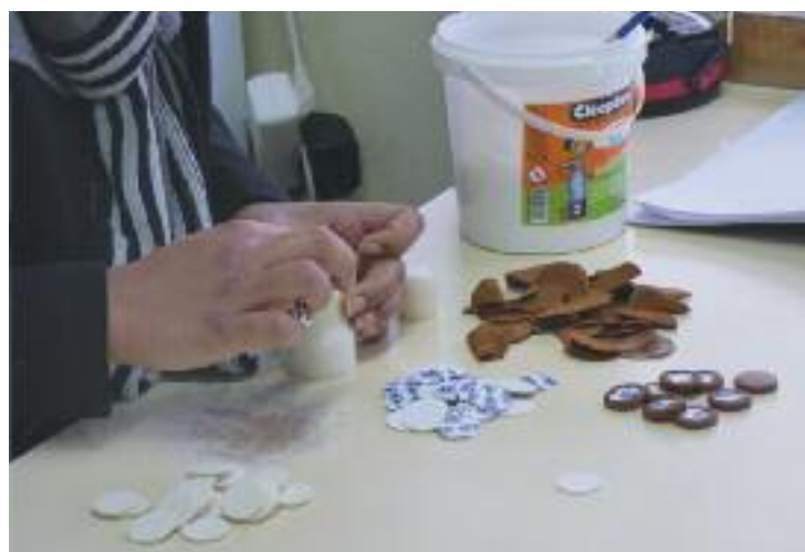
Fabrication des tampons