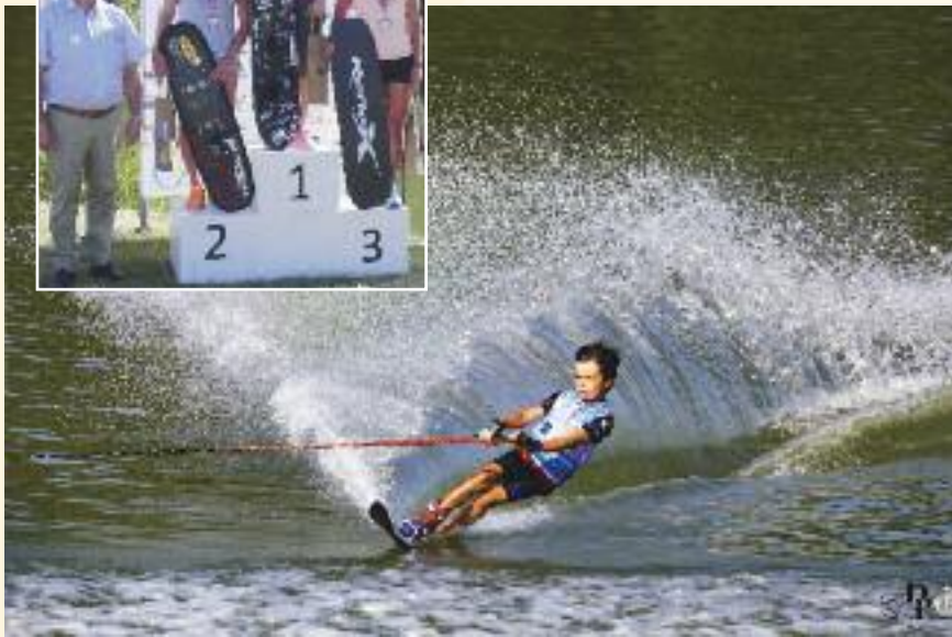
Championnat de France de ski nautique