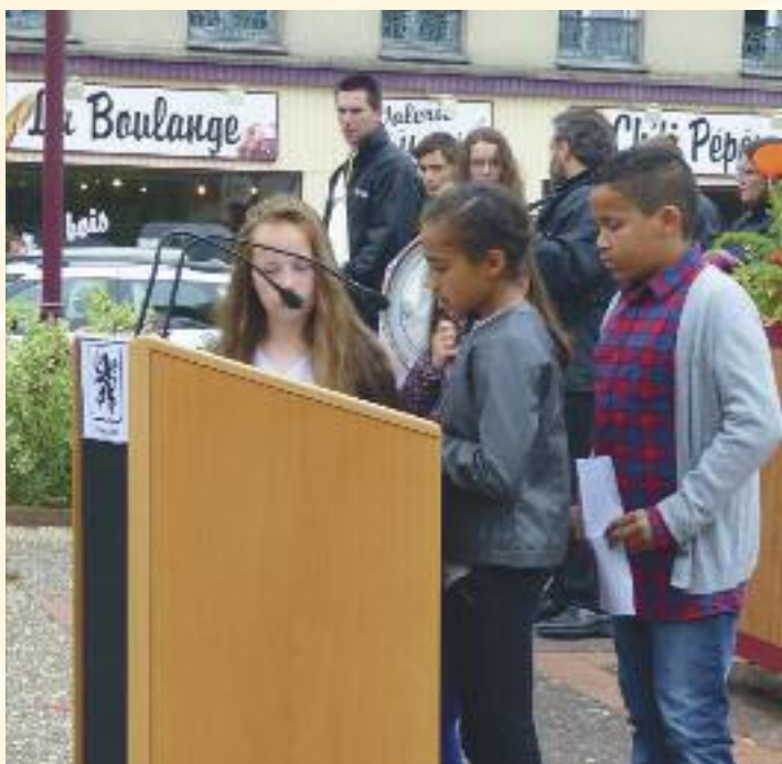
29 mai - Commémoration du centenaire de la Bataille de Verdun