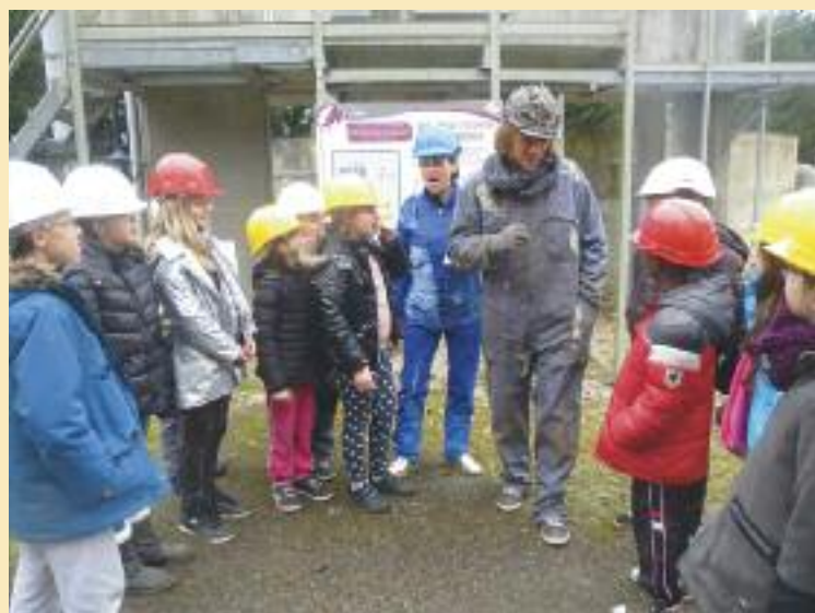
Visite théâtralisée de la station d'épuration

Tous les élèves d'Ezy ont été récompensés. La classe de Mme Malmaison a remporté le 3 ème prix. Chaque élève est reparti avec un « réveil à eau ». La classe de Mme Vatinet a remporté le 1 er prix. Les élèves se sont vus offrir un coffret pour construire un véhicule à eau.