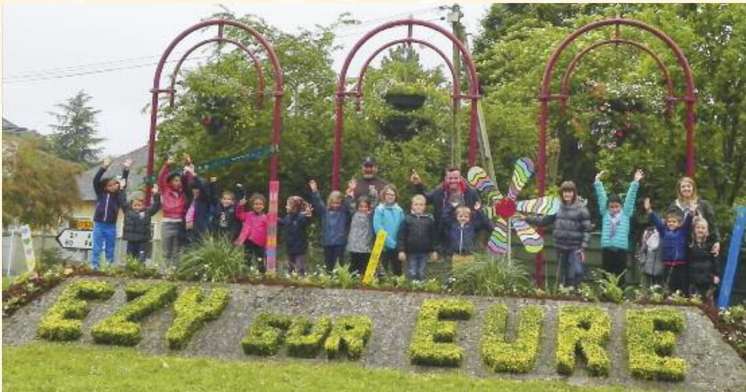
Le travail des enfants pour décorer leur ville