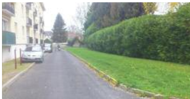
Résidence « Petite Cité » - Photographie avant travaux

S'agissant des chiffres, 175 mètres de bordures et caniveaux ont été posés, 120 tonnes de grave calcaire ainsi que 52 tonnes de matériaux enrobés ont été mis en œuvre.