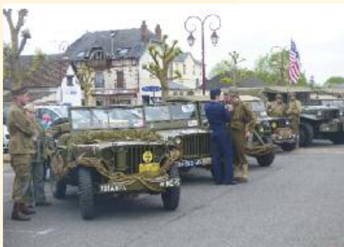
14 mai - 79th Memory Group