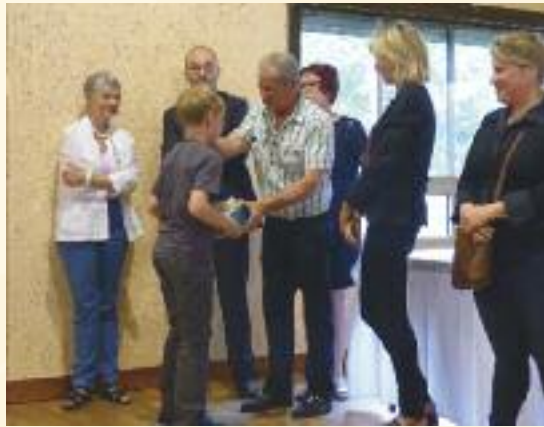
Remise des livres et dictionnaires