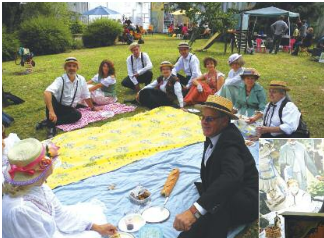
Un déjeuner sur l'herbe en forme de clin d'œil à un célèbre tableau

Les Amis du musée du Peigne avaient choisi de clore en beauté cette saison placée sous le sceau des impressionnistes en organisant un déjeuner sur l'herbe, petit clin d'œil au célèbre tableau de Monet.