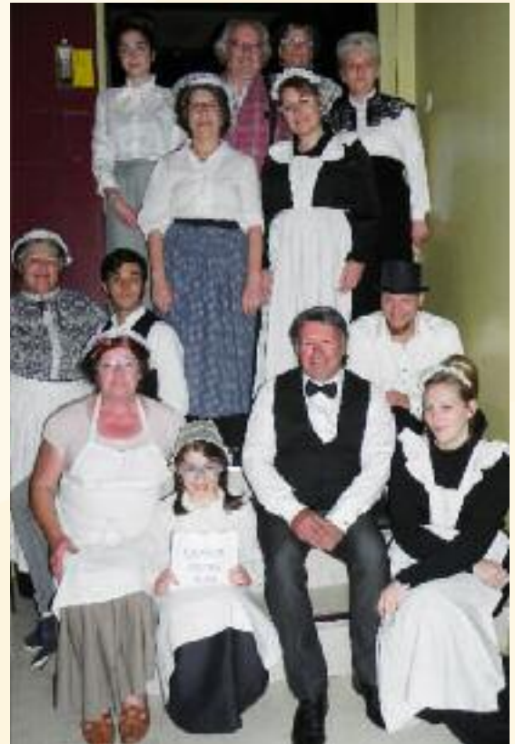
Théâtre adultes ALE