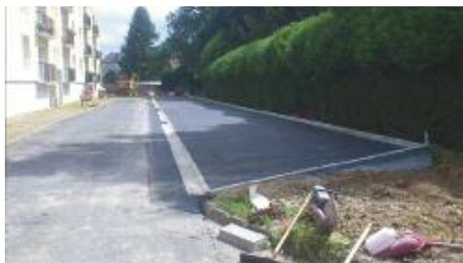
Résidence « Petite Cité » - Photographie après mise en œuvre des enrobés