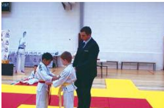
Samedi Classe kikido : né en 2010. Mercredi/vendredi Classe J7 : 2009, 2008 et débutant 2007 et Classe J8 : 2006, 2005 et 2007