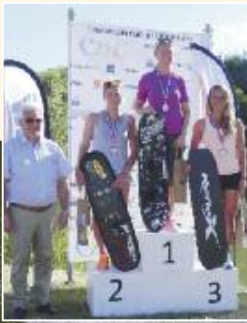
Remise de récompenses au Championnat de France de ski nautique