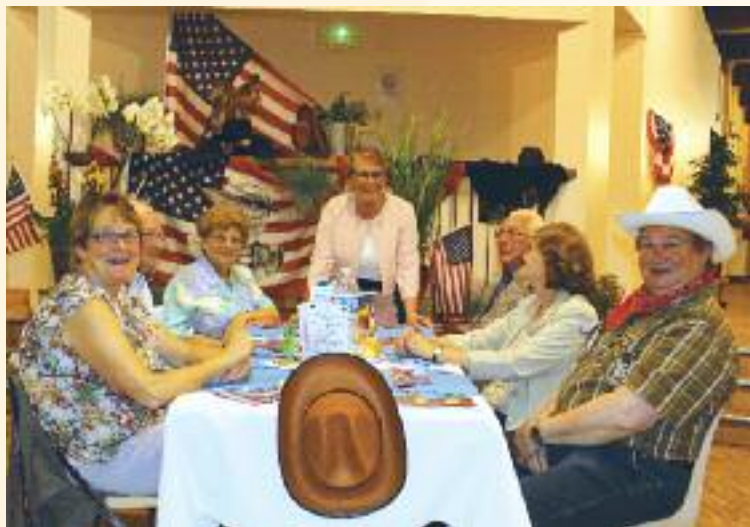
Banquet des sages