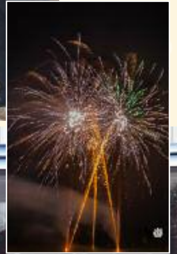
Feu d'artifice du 1 er octobre