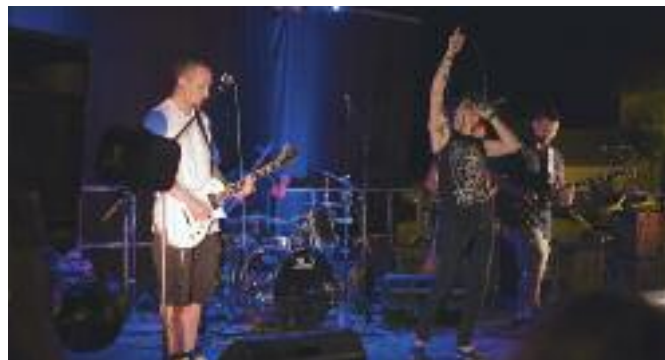
Fête de la Musique 2016