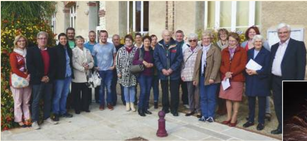
Remise des prix du concours des jardins fleuris