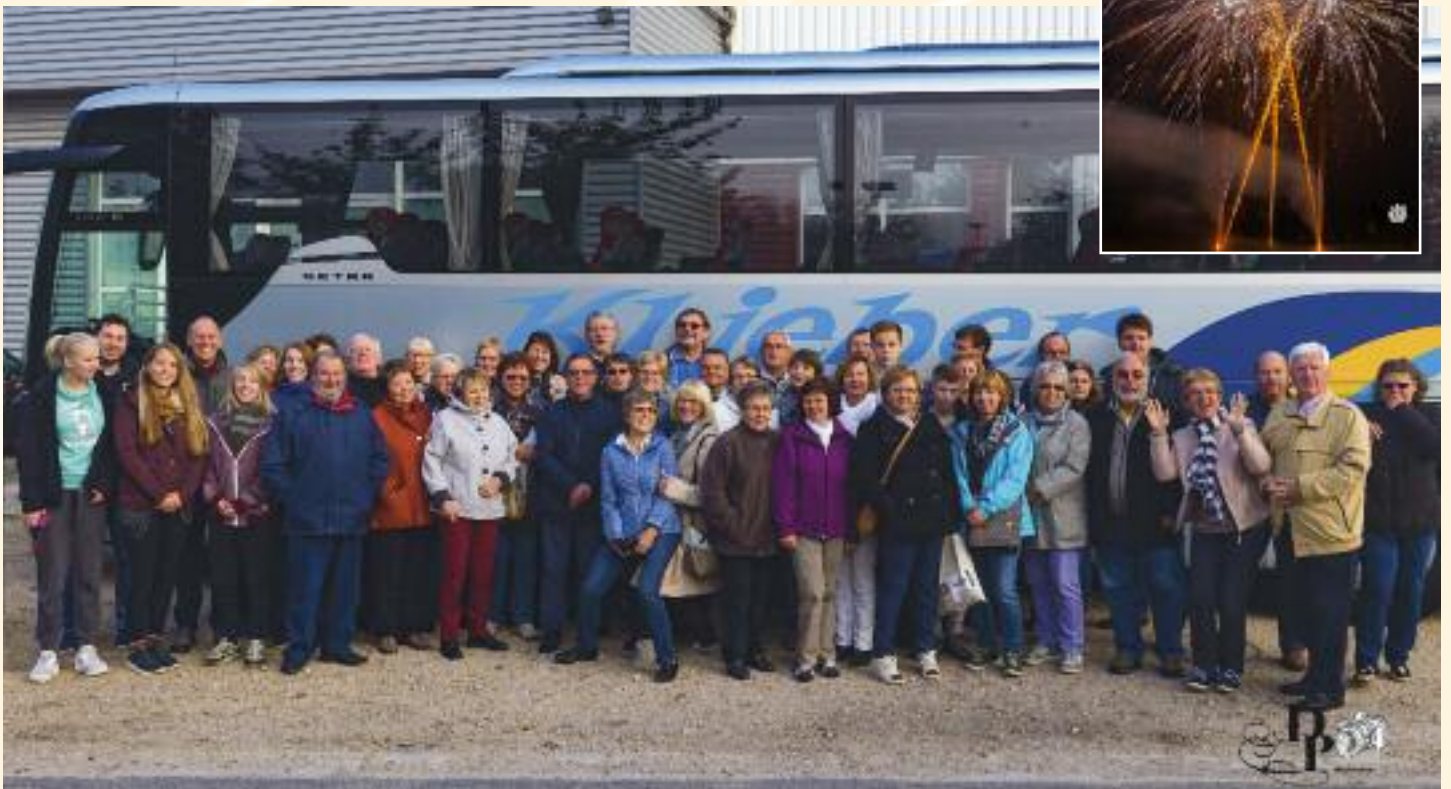
Visite de nos amis de Brensbach