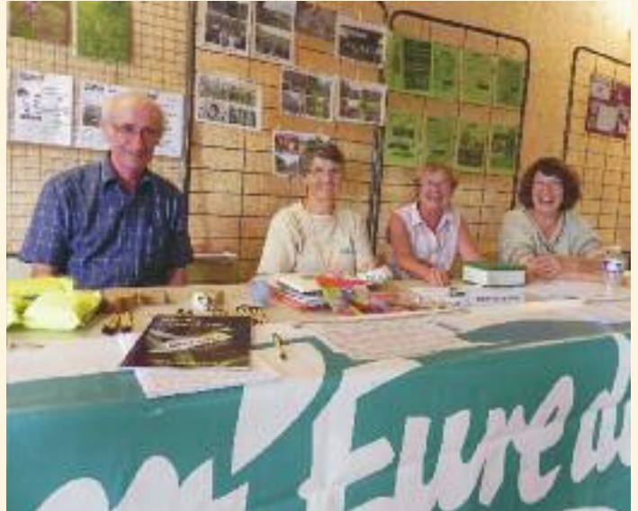
Forum des associations