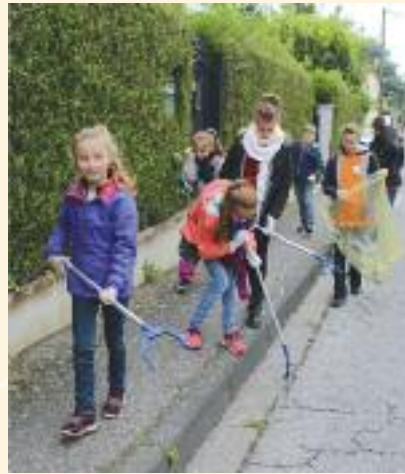
Nettoyage de printemps