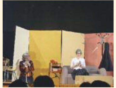
Théâtre enfants ALE