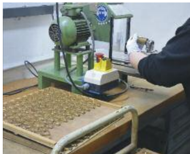
Fabrication des ligatures