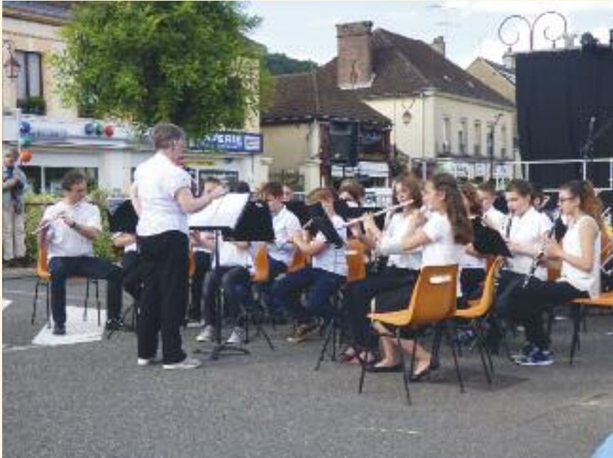
L'orchestre de l'école lors de la Fête de la musique