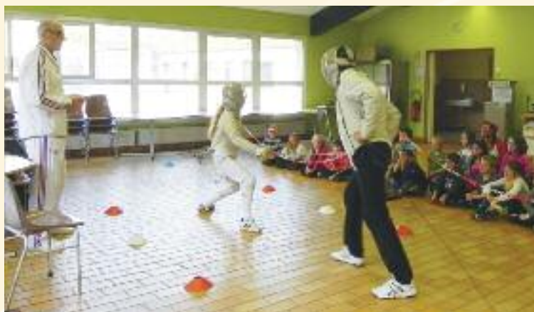
Journée le sport ma santé