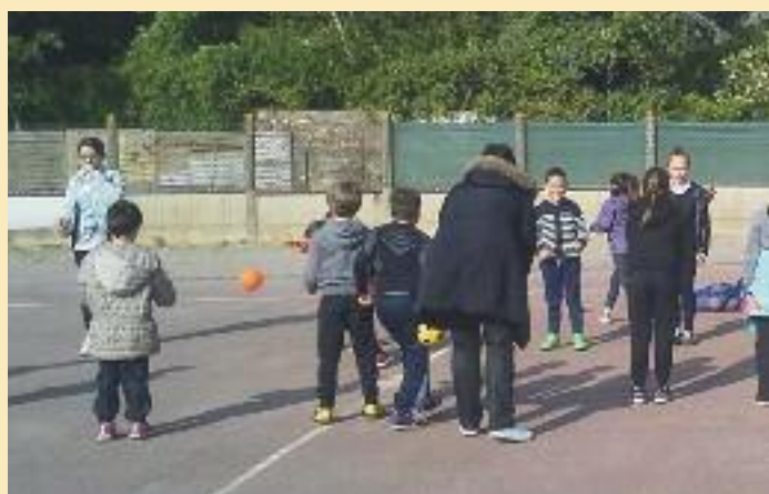
Participation au « Sport ma santé » avec le Péricolaire