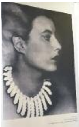
L'auteure Elsa Triolet concevait également des bijoux, objets de l'exposition au musée d'Evreux cet hiver