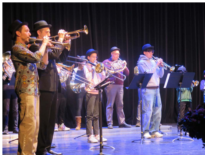
Les élèves et professeurs de cuivres du conservatoire ont ouvert la soirée