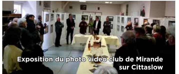
Exposition du photo video club de Mirande sur Cittaslow