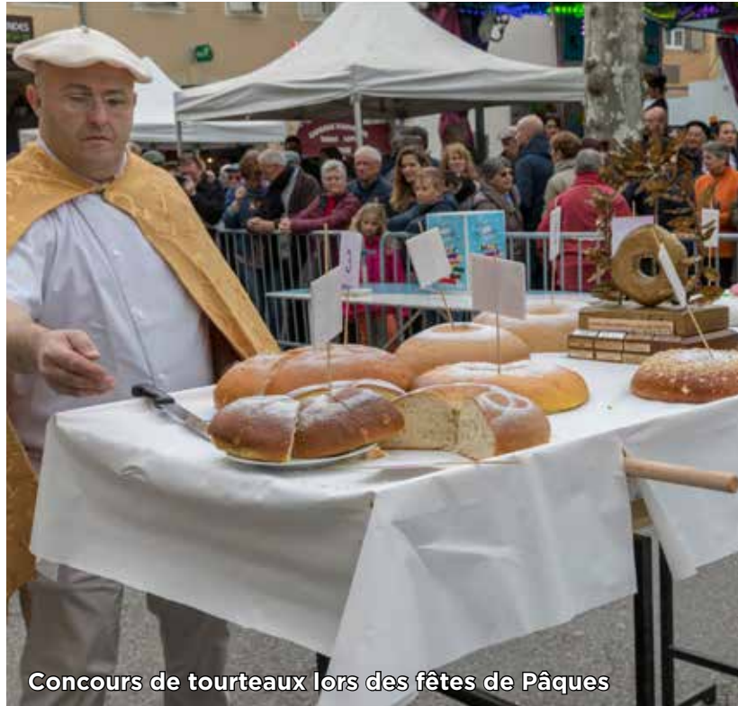
Concours de tourteaux lors des fêtes de Pâques