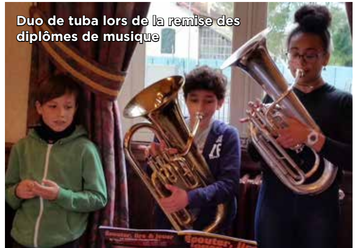
Duo de tuba lors de la remise des diplômes de musique