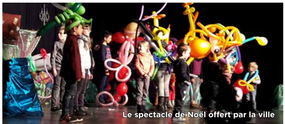
Le spectacle de Noël offert par la ville