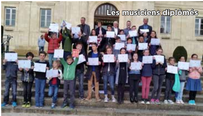
Les musiciens diplômés