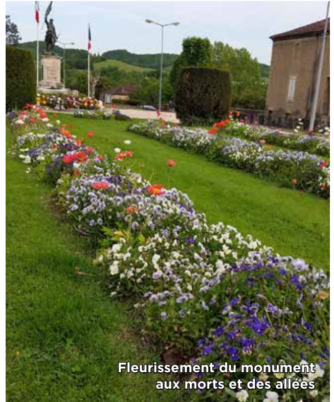
Fleurissement du monument aux morts et des allées