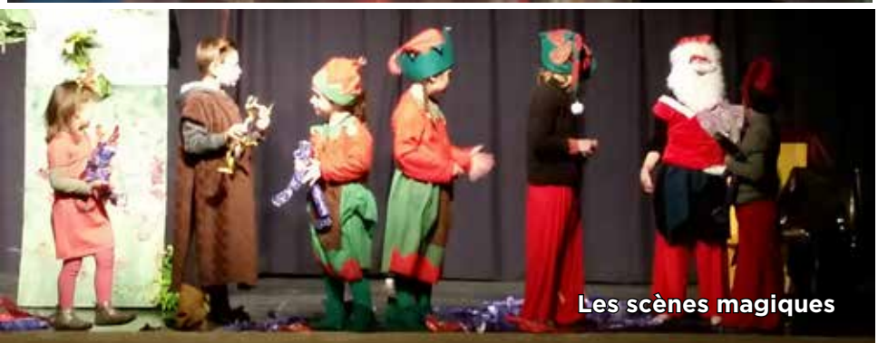
Les scènes magiques