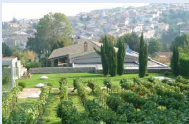
Visite d'Orsara Di Puglia en 2009.

Le schéma local de développement touristique permet de diagnostiquer un fort potentiel « nature » et un positionnement « art de vivre au naturel » pour notre territoire. Un patrimoine naturel et culturel varié, une vie associative intense favorisant échanges et convivialité, un souci permanent de préserver la qualité de vie des habitants et des visiteurs ont conduit MIRANDE à engager une démarche vers la labellisation.