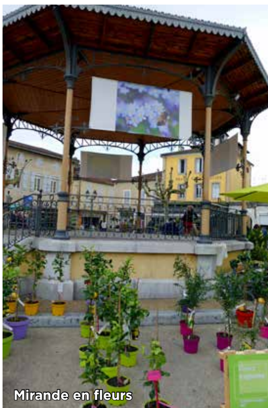
Mirande en fleurs