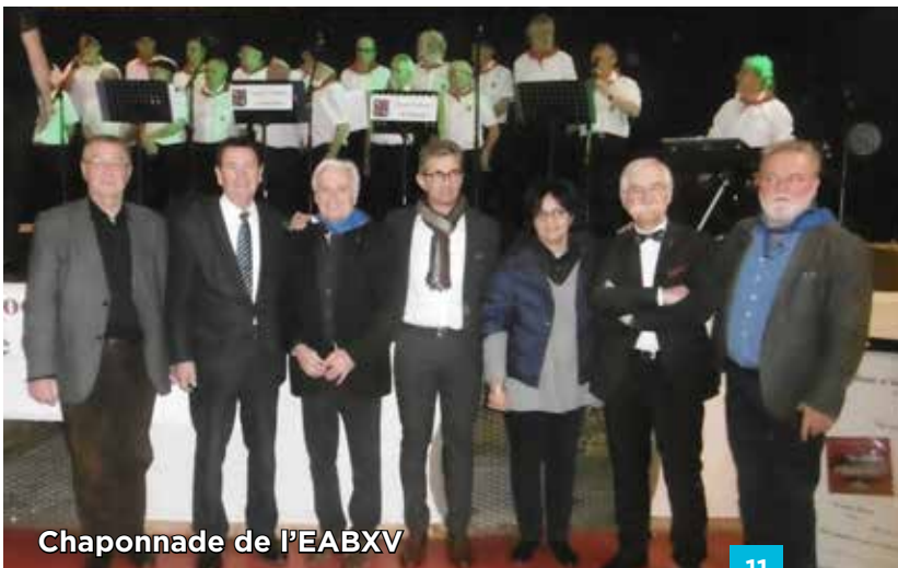
Chaponnade de l'EABXV