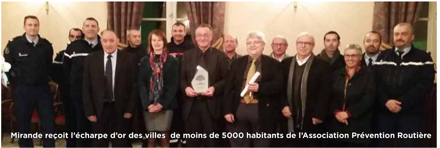
Mirande reçoit l'écharpe d'or des villes de moins de 5000 habitants de l'Association Prévention Routière