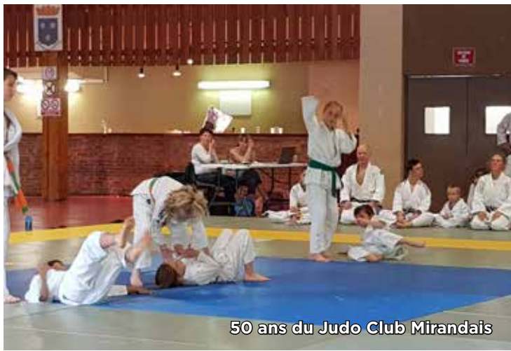
50 ans du Judo Club Mirandais