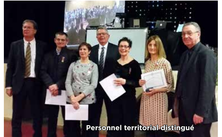
Personnel territorial distingué