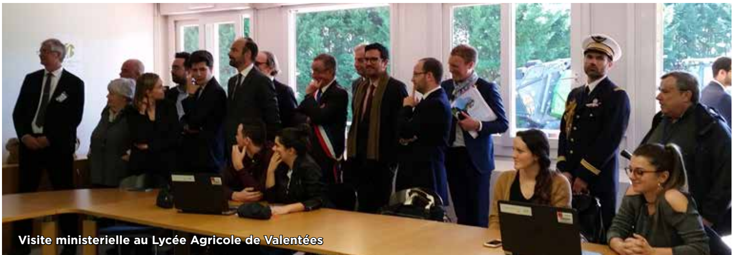
Visite ministérielle au Lycée Agricole de Valentées