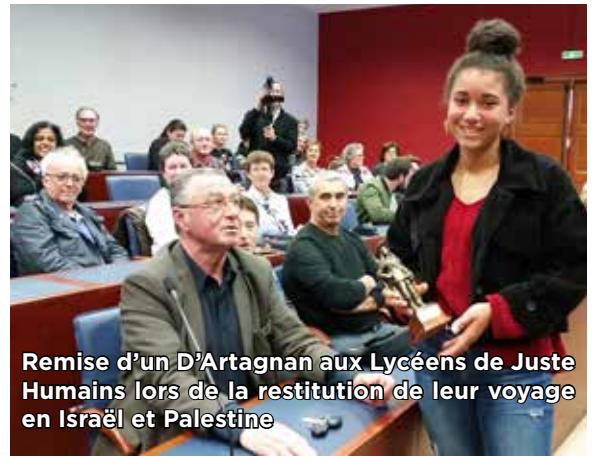
Remise d'un D'Artagnan aux Lycéens de Juste Humains lors de la restitution de leur voyage en Israël et Palestine