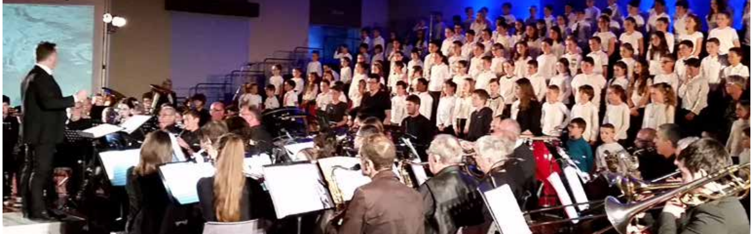
Concert de «Claude à Nougaro» par la Société Philharmonique et le chœur des écoliers Film disponible au Photo Vidéo club Mirandais