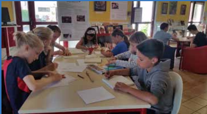
Participation des jeunes mirandais au Projet d'art proposé par le lycée de Korntal Munchingen sur le thème de La Patrie « Représenter un objet qui te rappelle l'endroit où tu te sens chez toi », 15 cartes peintes de chaque ville jumelle seront exposées dans le cadre du bicentenaire de korntal-Munchingen puis successivement à Tubize et Mirande.