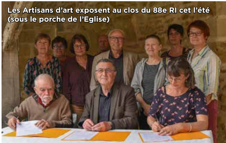
Les Artisans d'art exposent au clos du 88e RI cet l'été (sous le porche de l'Eglise)