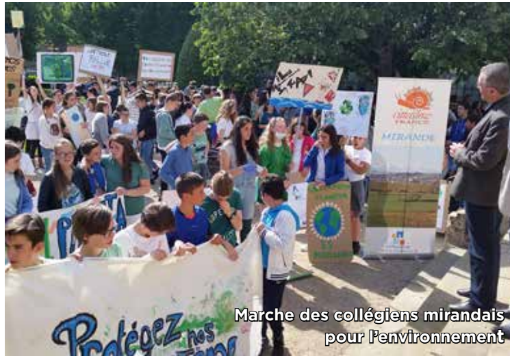
Marche des collégiens mirandais pour l'environnement