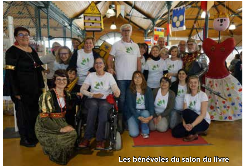
Les bénévoles du salon du livre