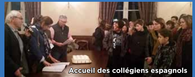
Accueil des collégiens espagnols