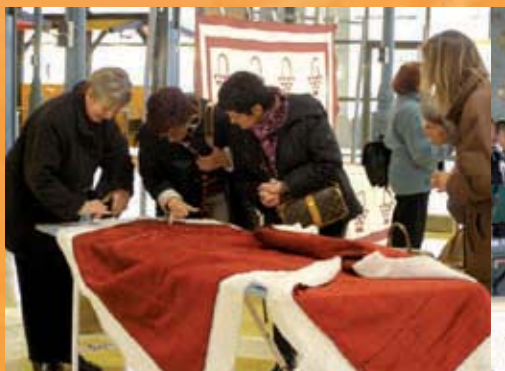
Salon du patchwork les 14 et 15 Novembre dernier sous la halle