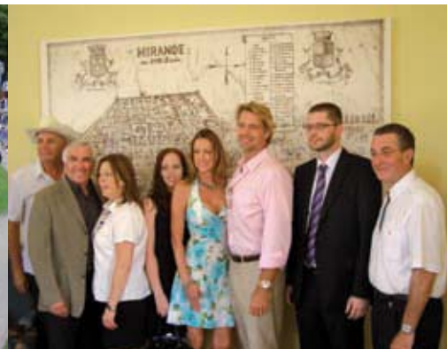
Accueil de John Schneider parrain du Festival Country Music 2008 à la mairie en présence de Messieurs le maire et le sous-préfet.