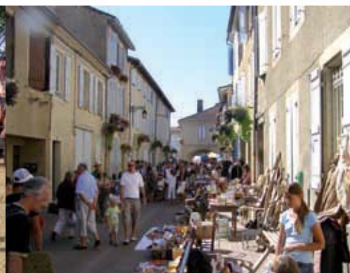
Ville piétonne 15 Août 2008.