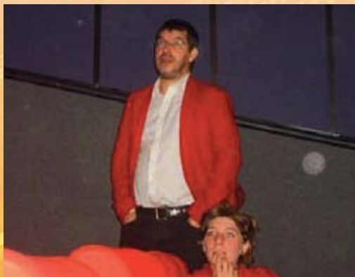
le 24 Septembre 2008 Pierre Schoeller réalisateur de « Versailles »