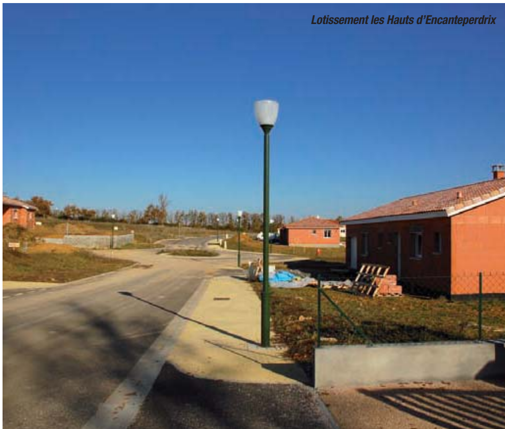
Lotissement les Hauts d'Encanteperdrix

De même, la desserte par le réseau gaz est considérée comme un élément facultatif.