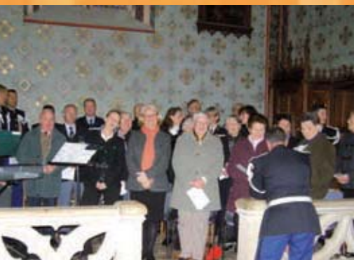
Office religieux à l'Eglise Sainte Marie lors de la cérémonie de la Sainte Geneviève, le 28 Novembre 2008.