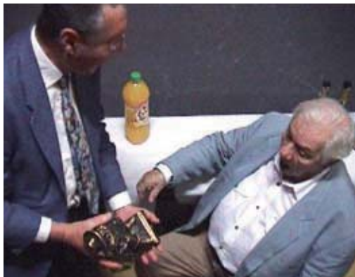
Rencontre avec Michel Galabru

Lors de sa représentation de « M. AMELEE » à la salle A. Beaudran en mai dernier. M. le maire lui remet un d'Artagnan qui tiendra compagnie à son Molière a t'il dit !