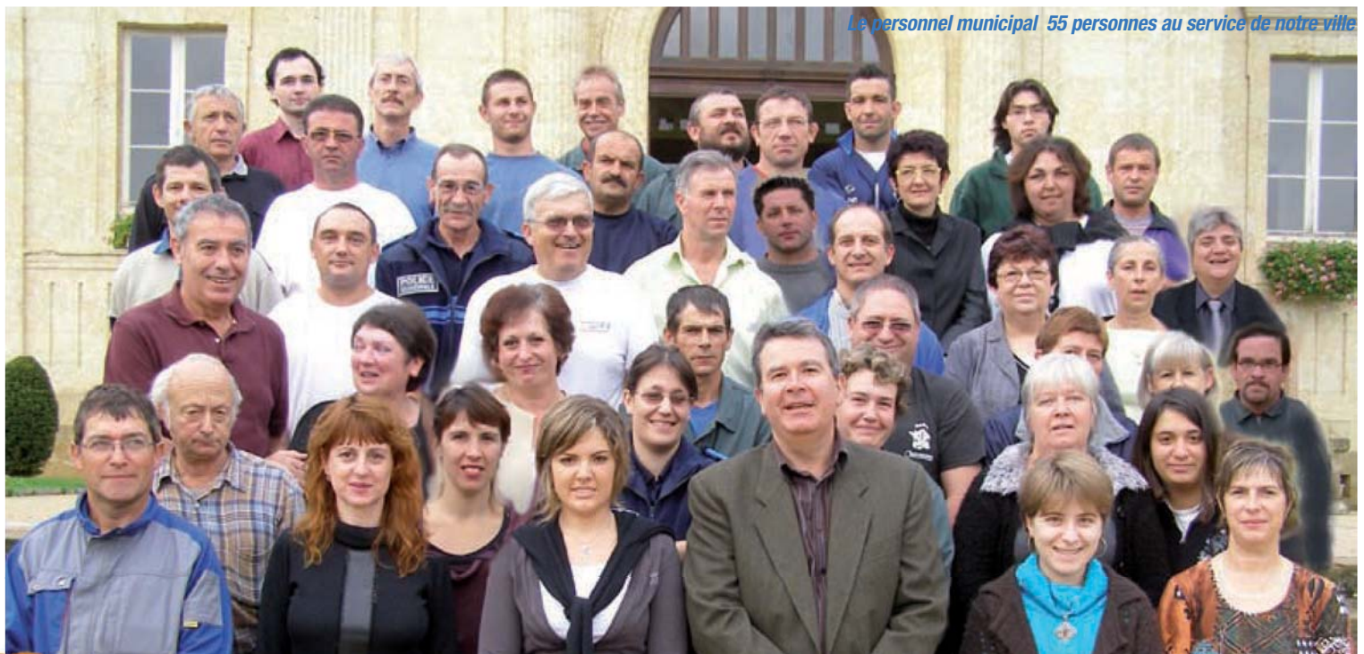
Le personnel municipal 55 personnes au service de notre ville