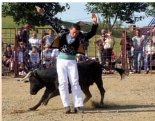
Une première à Mirande : Course landaise à l'occasion des fêtes patronales du 15 Août 2008.