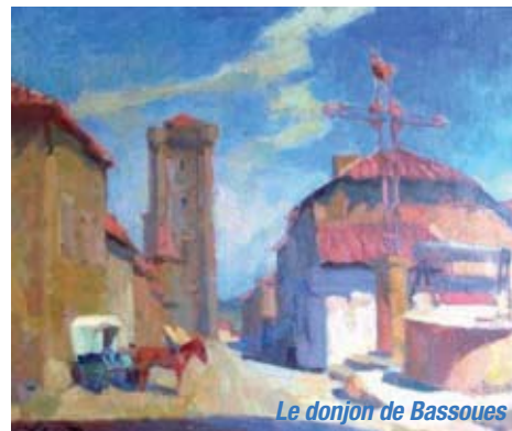
Le donjon de Bassoues