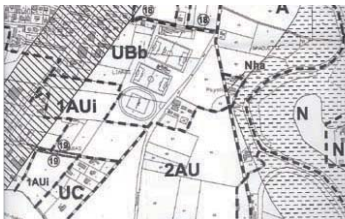
Zone 1AUi : zone à vocation d'activité industrielle, commerciale ou artisanale, non encore équipée et qui a vocation, après équipement, à être intégrée en zone UI (zone d'activités artisanales, commerciales ou industrielles)

LE PROJET D'AMÉNAGEMENT ET DE DÉVELOPPEMENT DURABLE définit les orientations d'urbanisme et les aménagements retenus par la Commune.