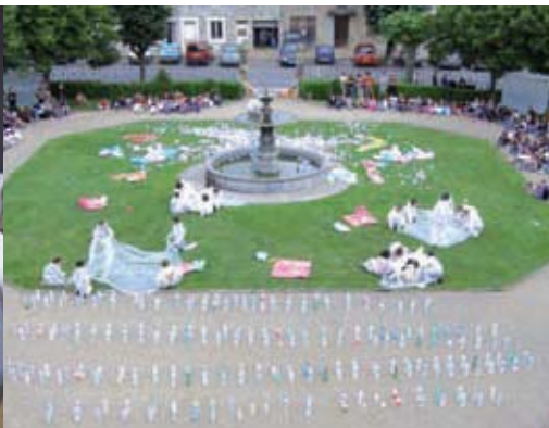
Les jardins de la mairie ont été investis, en fin d'année scolaire, pour une performance artistique du Collège de l'Astarac afin d'illustrer un travail de plusieurs semaines sur la pollution et de dénoncer le phénomène.

Lors de sa représentation de « M. AMELEE » à la salle A. Beaudran en mai dernier. M. le maire lui remet un d'Artagnan qui tiendra compagnie à son Molière a t'il dit !