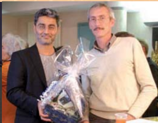
le 17 Octobre 2008 Barmak Akram réalisateur de « Kaboul kid » dans le cadre du Festival Ciné32

2 cinéastes sont venus au Ciné-Astarac à la rencontre d'un public enthousiaste