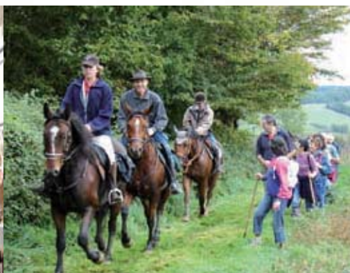
4 ème édition de la Randonnée à pied, à cheval, à vélo et en attelage entre Mirande & Montesquiou organisée par les Amis Randonneurs. (200 randonneurs dont 80 chevaux et une superbe météo) Octobre 2008.