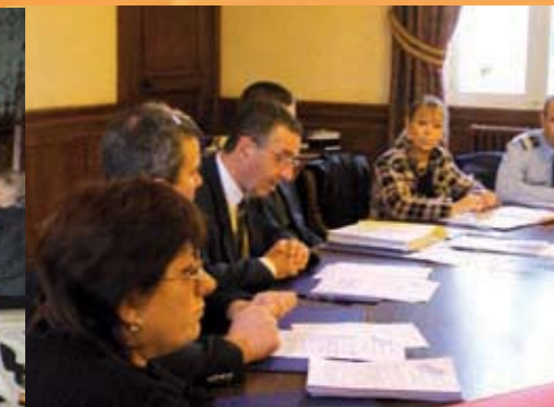
Première réunion de travail du Conseil Local de Sécurité et de Prévention de la Délinquance tenue le 25 Novembre par le maire en présence de M. le Sous-Préfet et de Mme la Procureur de la République.