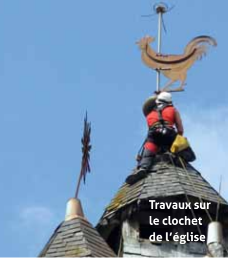
Travaux sur le clochet de l'église