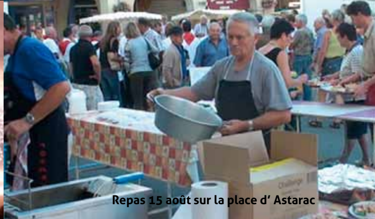
Repas 15 août sur la place d' Astarac