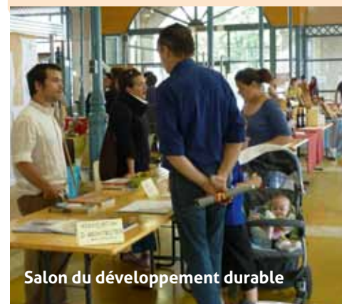
Salon du développement durable