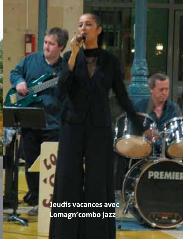
Jeudis vacances avec Lomagn'combo jazz