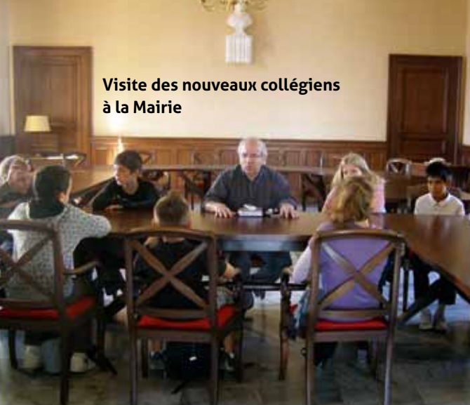
Visite des nouveaux collégiens à la Mairie