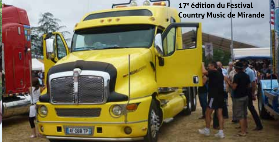
17 e édition du Festival Country Music de Mirande