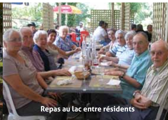
Repas au lac entre résidents