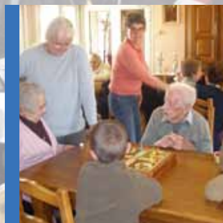
La Résidence de Lézian, un après-midi intergénérationnel