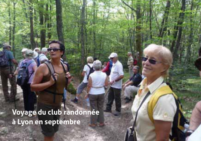
Voyage du club randonnée à Lyon en septembre