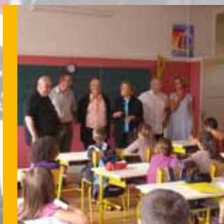
Du côté des écoles