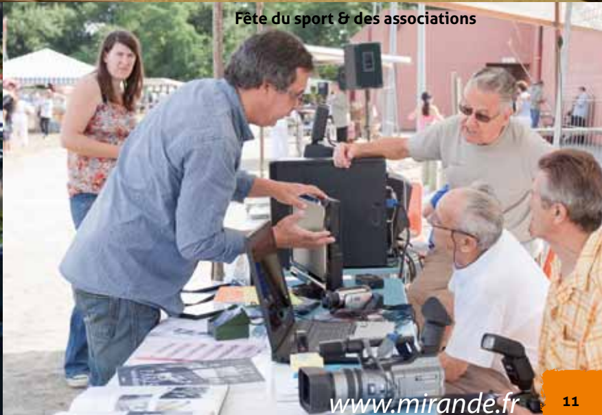
Fête du sport & des associations