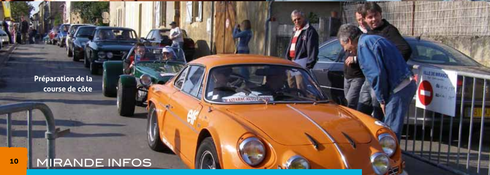
Préparation de la course de côte