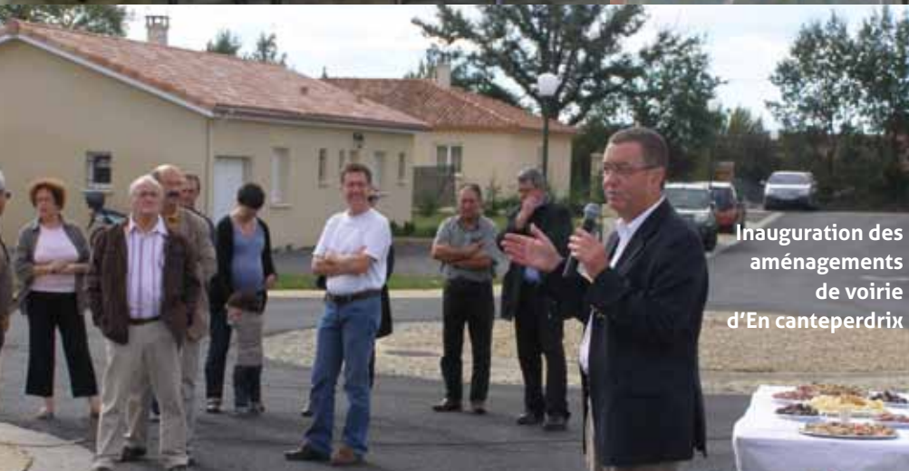
Inauguration des aménagements de voirie d'En canteperdrix