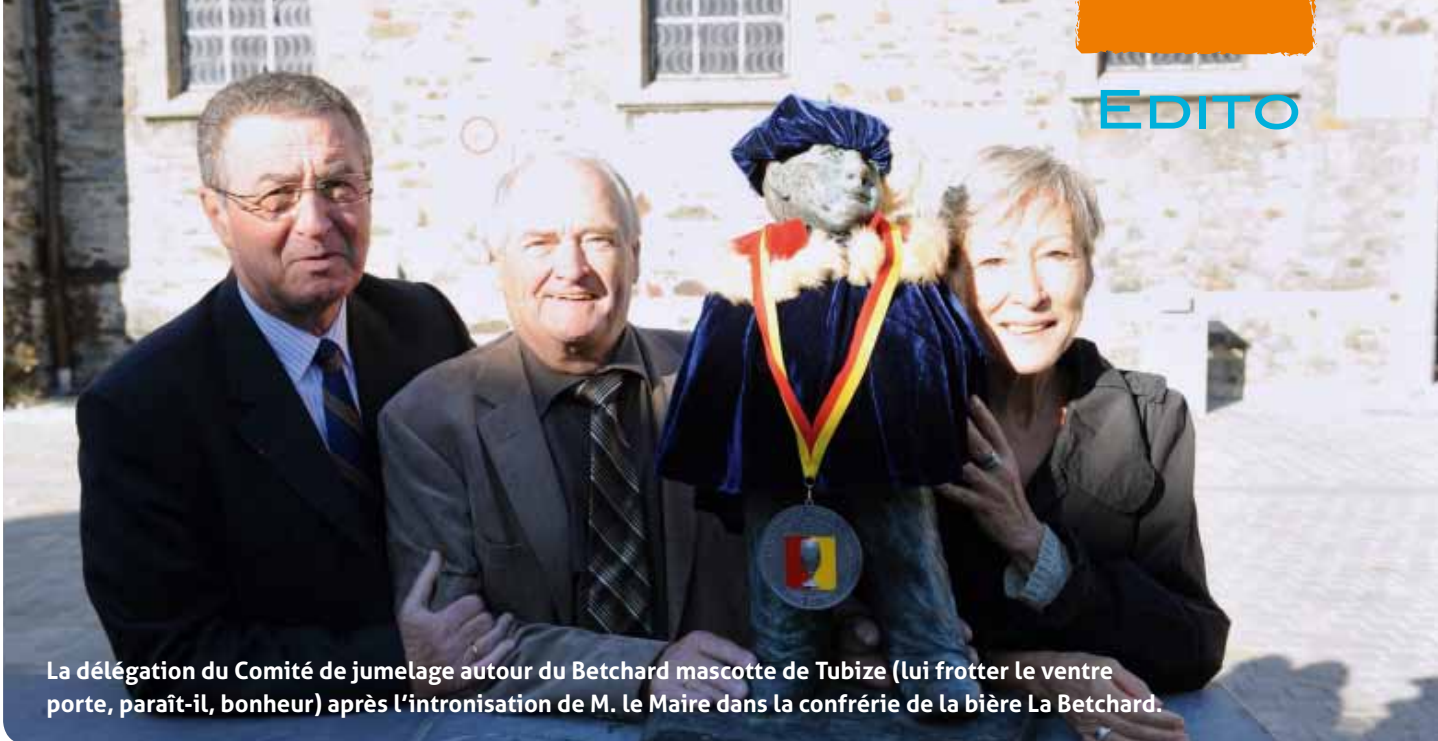
La délégation du Comité de jumelage autour du Betchard mascotte de Tubize (lui frotter le ventre porte, paraît-il, bonheur) après l'intronisation de M. le Maire dans la confrérie de la bière La Betchard.