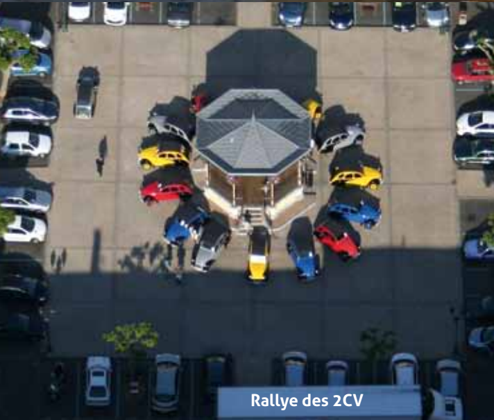
Rallye des 2CV