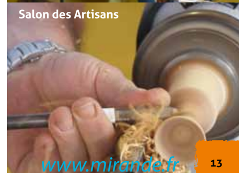
Salon des Artisans