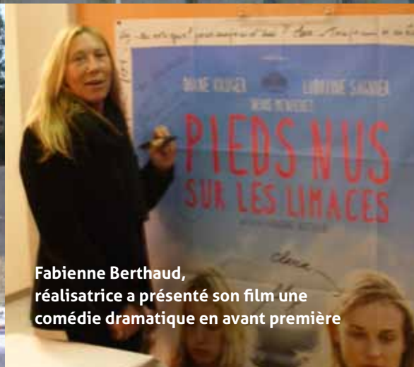
Fabienne Berthaud, réalisatrice a présenté son film une comédie dramatique en avant première