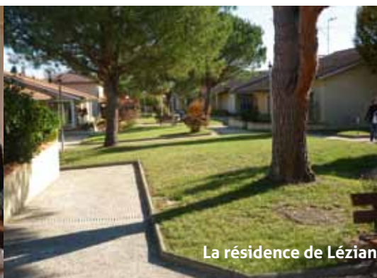
La résidence de Lézien