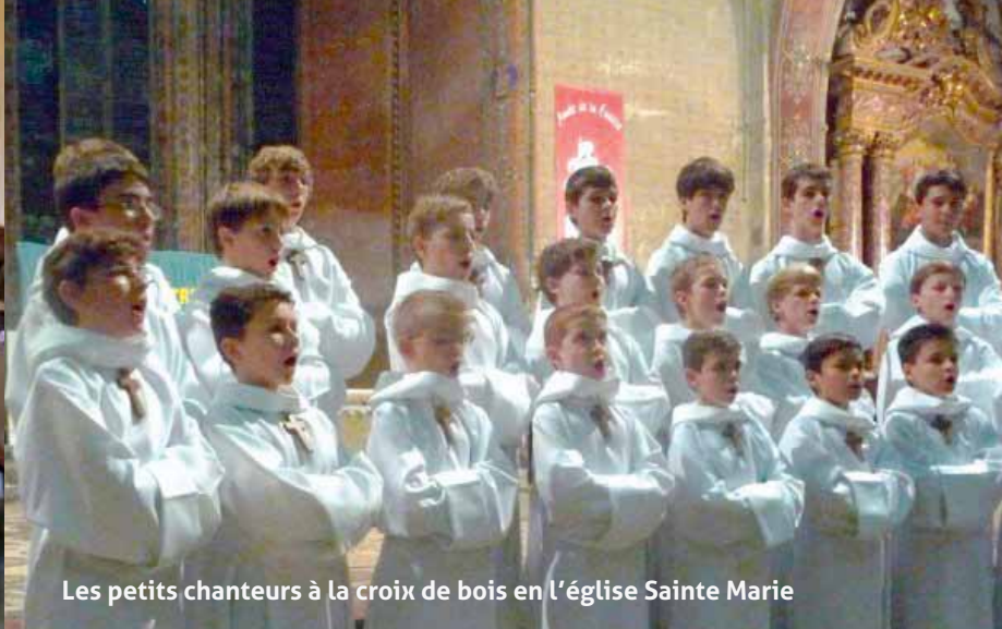
Les petits chanteurs à la croix de bois en l'église Sainte Marie