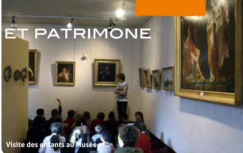
Visite des enfants au Musée