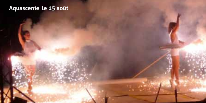
Aquascenie le 15 août