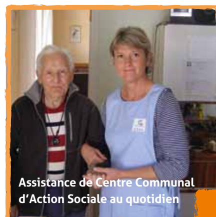
Assistance de Centre Communal d'Action Sociale au quotidien