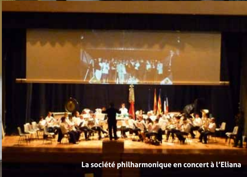
La société philharmonique en concert à l'Elia