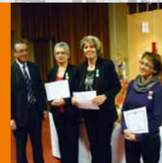
DOSSIER : Le personnel de la ville de Mirande