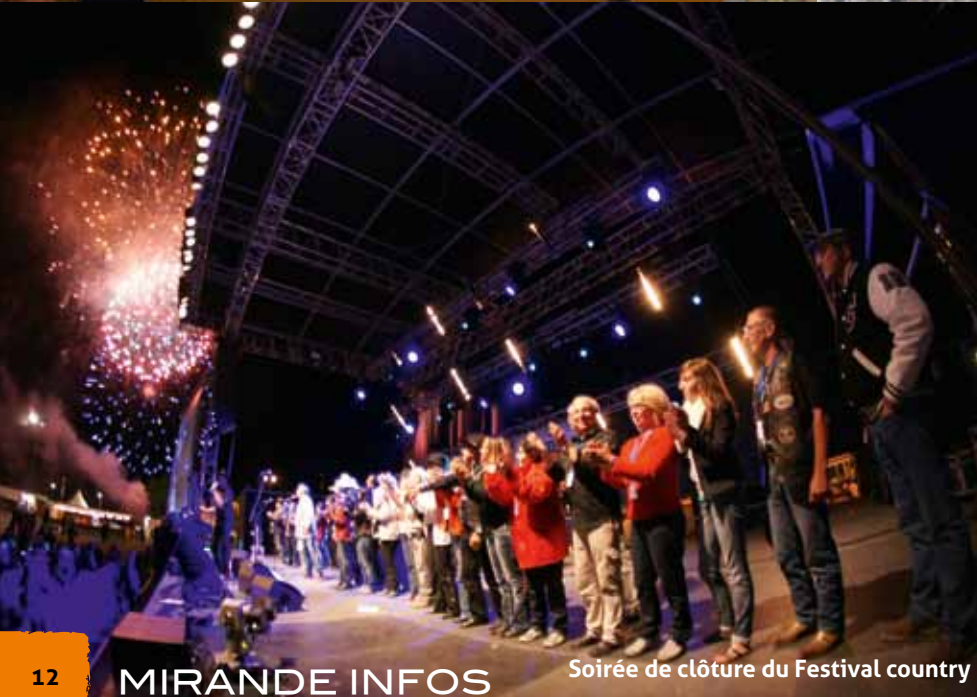
Soirée de clôture du Festival country