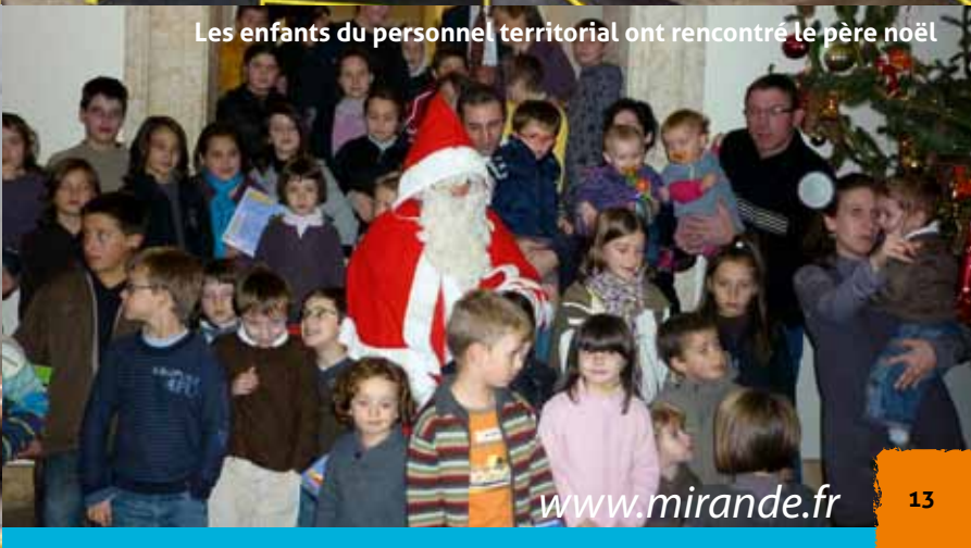
Les enfants du personnel territorial ont rencontré le père Noël