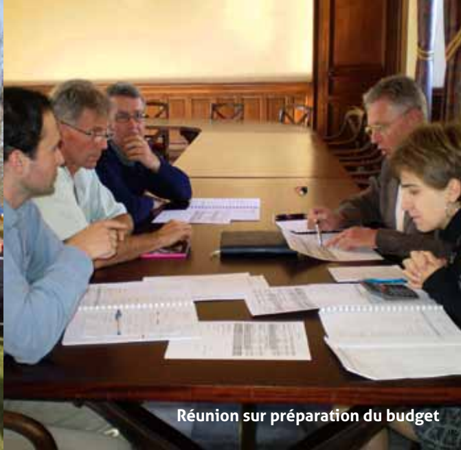
Réunion sur préparation du budget