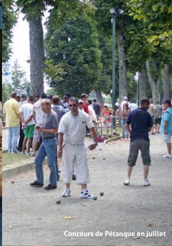
Concours de Pétanque en juillet