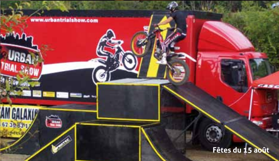
Fêtes du 15 août