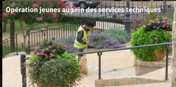
Opération jeunes au sein des services techniques