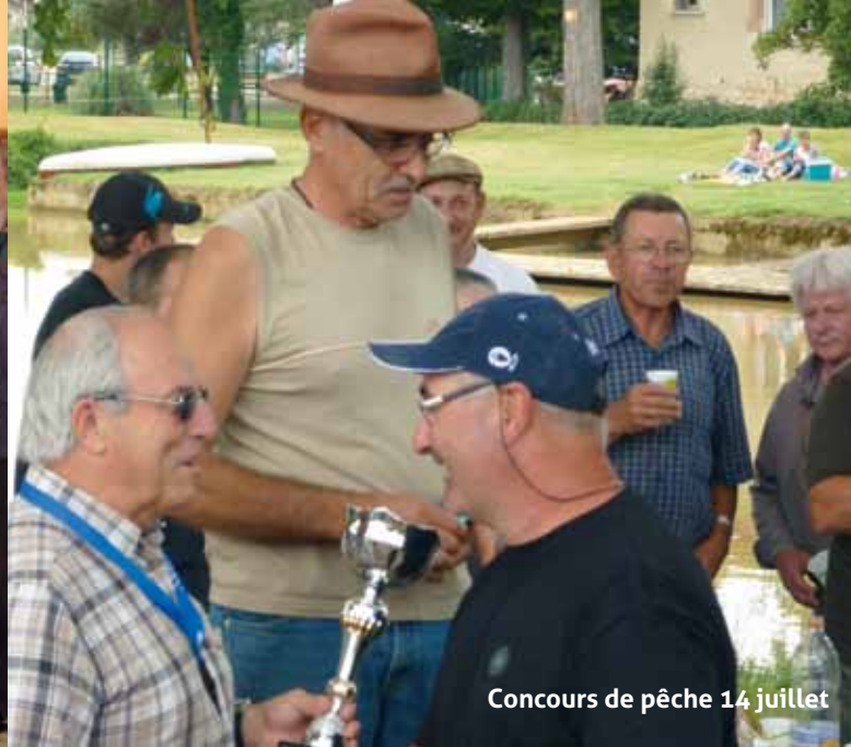
Concours de pêche 14 juillet