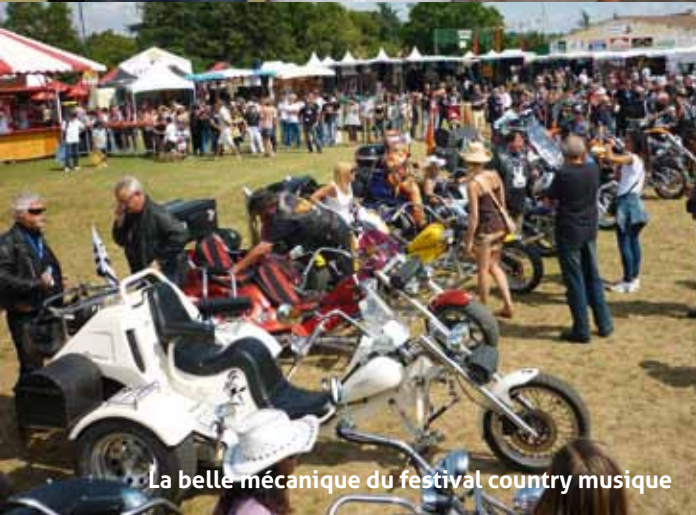
La belle mécanique du festival country musique