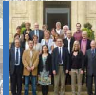
Europe & Jumelage