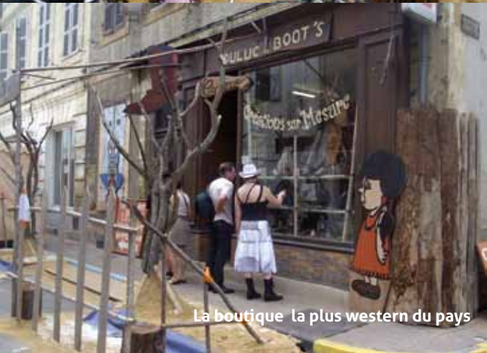
La boutique la plus western du pays