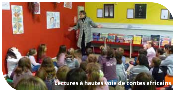
Lectures à hautes voix de contes africains