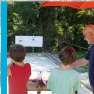
La fête du sport et des associations