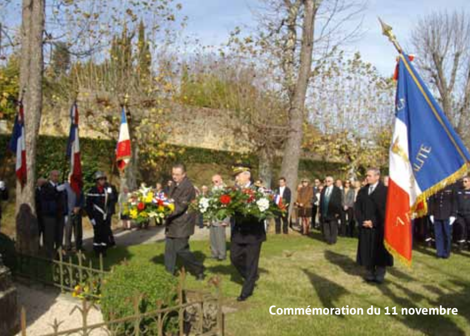
Commémoration du 11 novembre