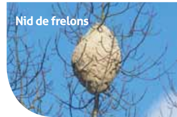
Nid de frelons

Depuis l'été 2009, cette espèce s'est implantée dans notre région. Cet été Mirande n'a pas échappé au phénomène. Il est intéressant de savoir que pour tout signalement d'un nid et d'une situation d'urgence et de danger, il faut composer le 18; pour tout renseignement sur l'espèce ou destruction contacter le service de sécurité intérieur de la Préfecture au 05 62 61 43 43.