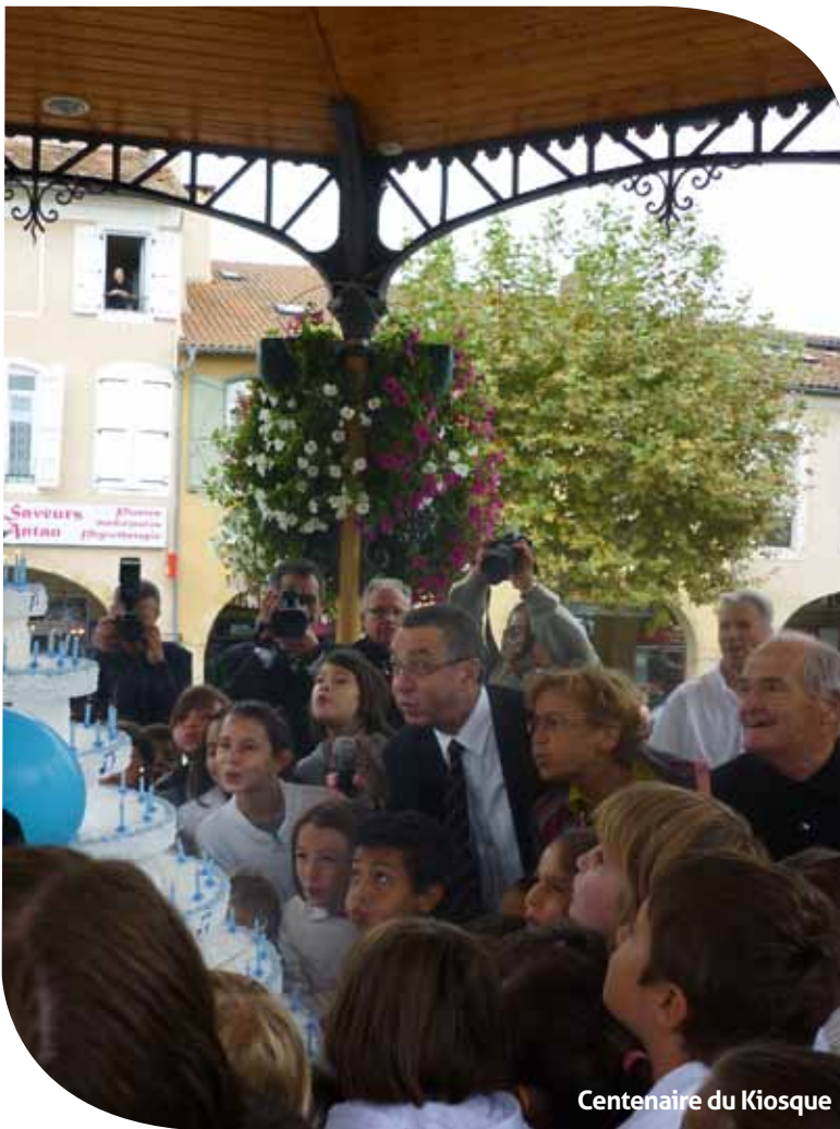
Centenaire du Kiosque