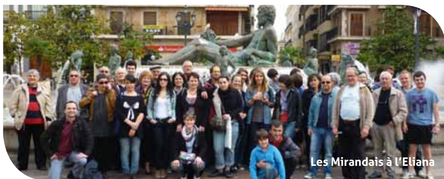
Les Mirandais à L'Eliana