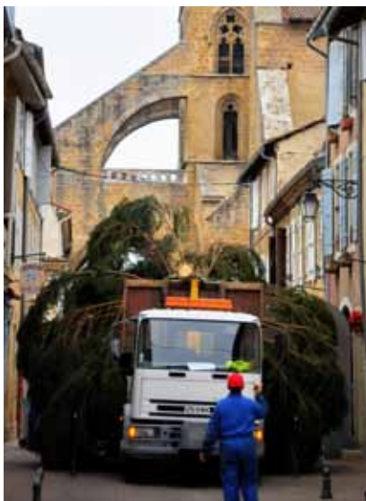
Pas facile d'acheminer ce sapin de 6 m de circonférence et 12 m de haut jusqu'à la place d'Astarac