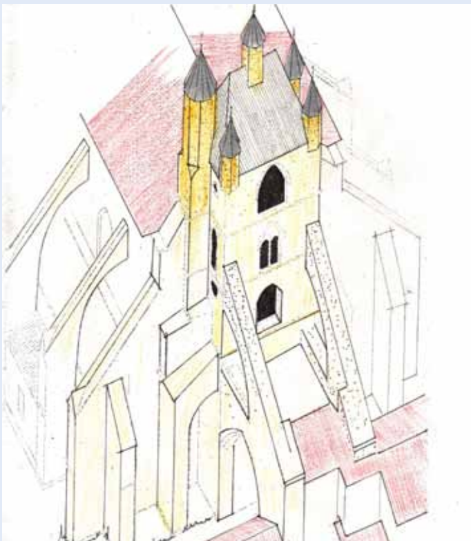
Croquis de la première tranche des travaux de l'Église Sainte-Marie par Michel Tharan

C'est la participation de l'association du «Renouveau de la Bastide» qui dynamise l'action et le mécénat populaire. Si, dans quelques mois la participation des Mirandaises et des Mirandais, entre autres, est satisfaisante, la Fondation du Patrimoine pourra demander une aide supplémentaire à d'autres partenaires (à ses propres mécènes) qui encouragent principalement des projets de sauvegarde et de mise en valeur d'édifices religieux faisant l'objet d'une souscription publique menée sous l'égide de la Fondation de Patrimoine.