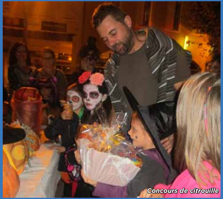
Concours de citrouille