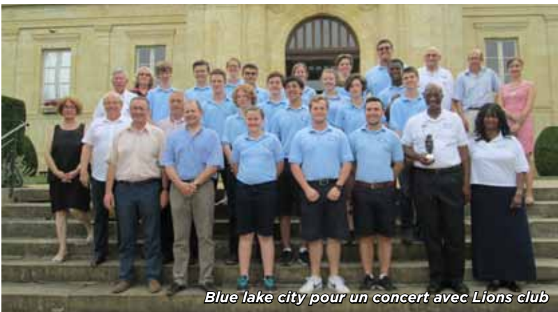
Blue lake city pour un concert avec Lions club