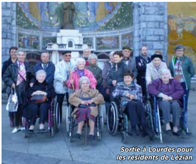
Sortie à Lourdes pour les résidents de Lézian