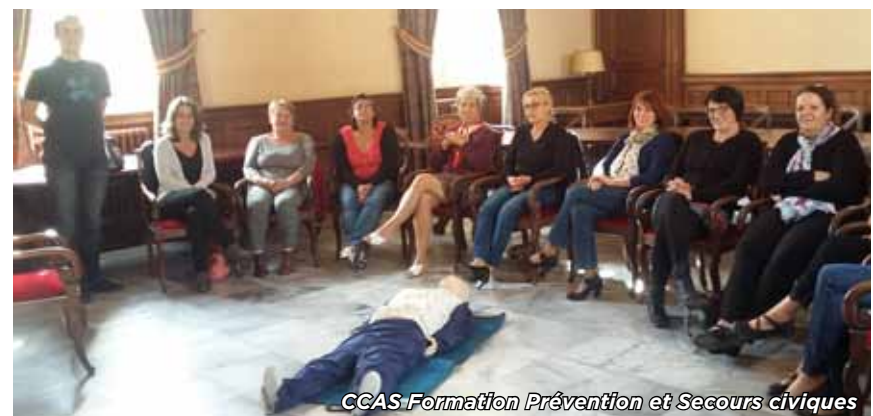
CCAS Formation Prévention et Secours civiques