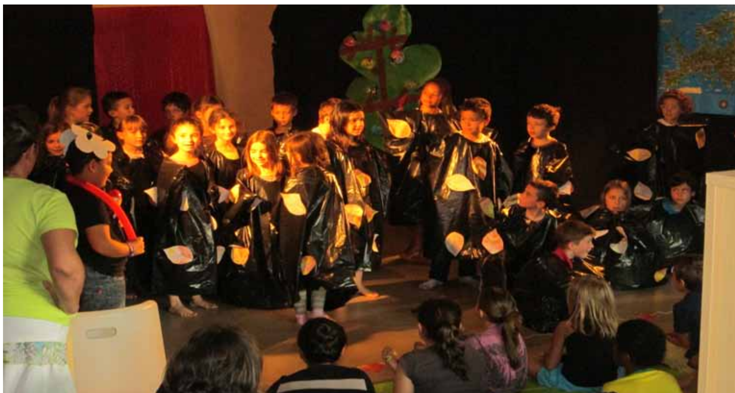
Le coût des activités périscolaires a représenté 31 602 € pour la commune en 2015

■ LES ENFANTS DE L'ÉCOLE ÉLÉMENTAIRE ont également la possibilité de participer à des études surveillées, tous les soirs de 16h15 à 17h15, sous la responsabilité du personnel enseignant.