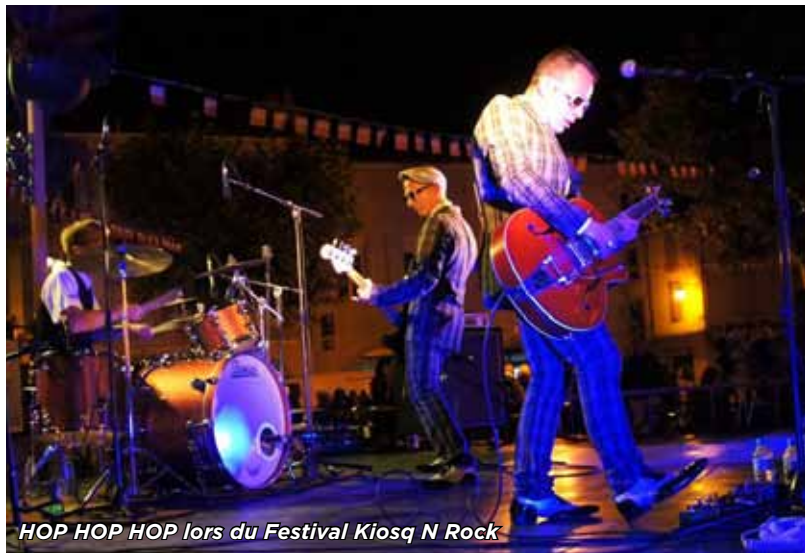
HOP HOP HOP lors du Festival Kiosq N Rock