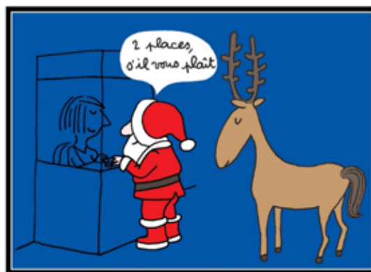
Illustration : SOLEDAD