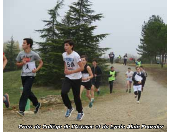
Cross du Collège de l'Astarac et du Lycée Alain Fournier