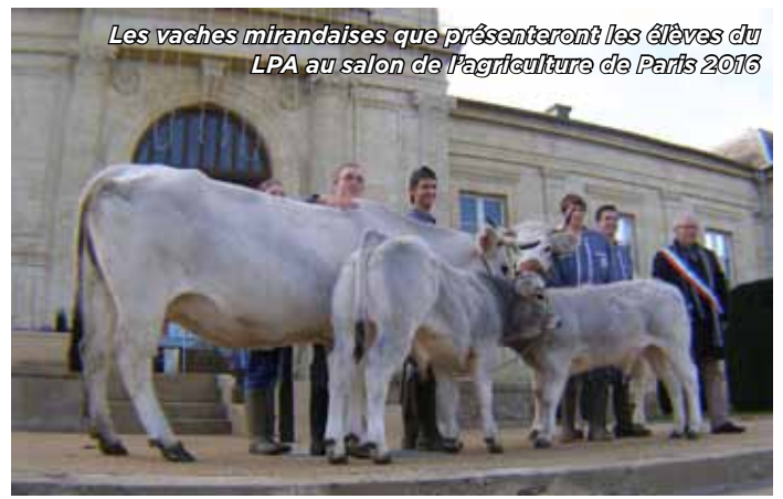
Les vaches mirandaises que présenteront les élèves du LPA au salon de l'agriculture de Paris 2016