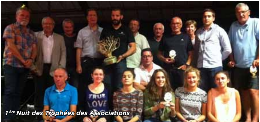
1 ère Nuit des Trophées des Associations