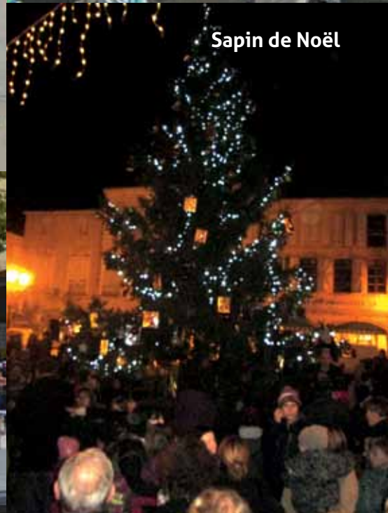
Sapin de Noël