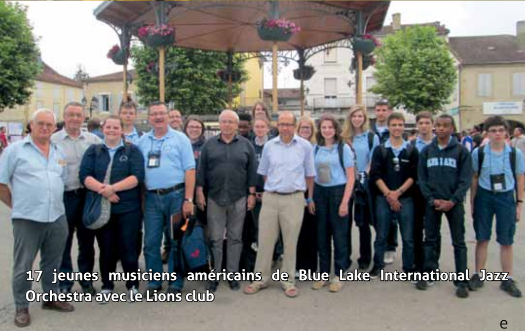
17 jeunes musiciens américains de Blue Lake International Jazz Orchestra avec le Lions club