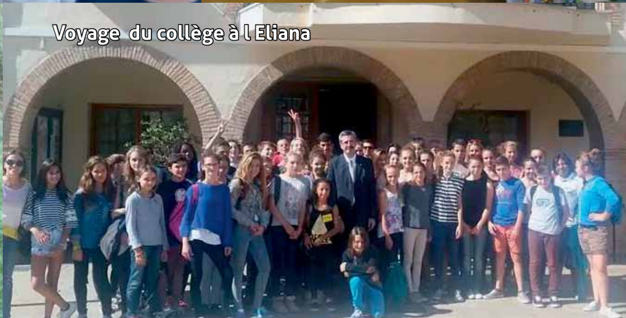
Voyage du collège à l'Eliana