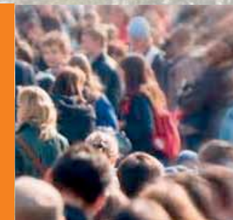
DOSSIER : Le Recensement p8