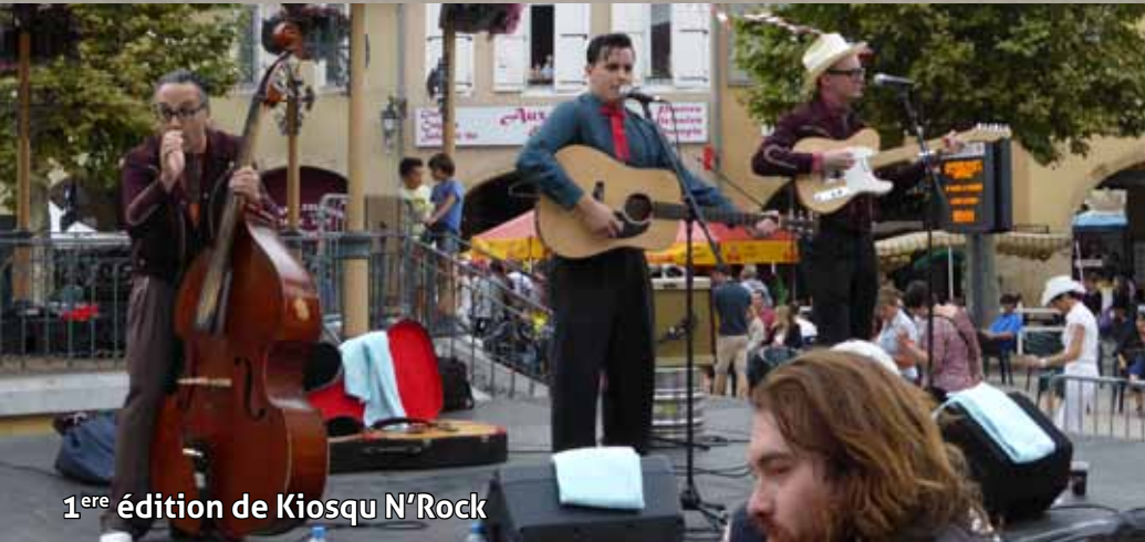
1 ère édition de Kiosqu N'Rock