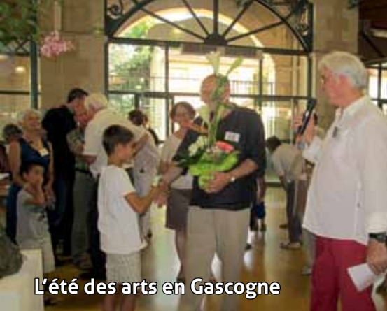
L'été des arts en Gascogne