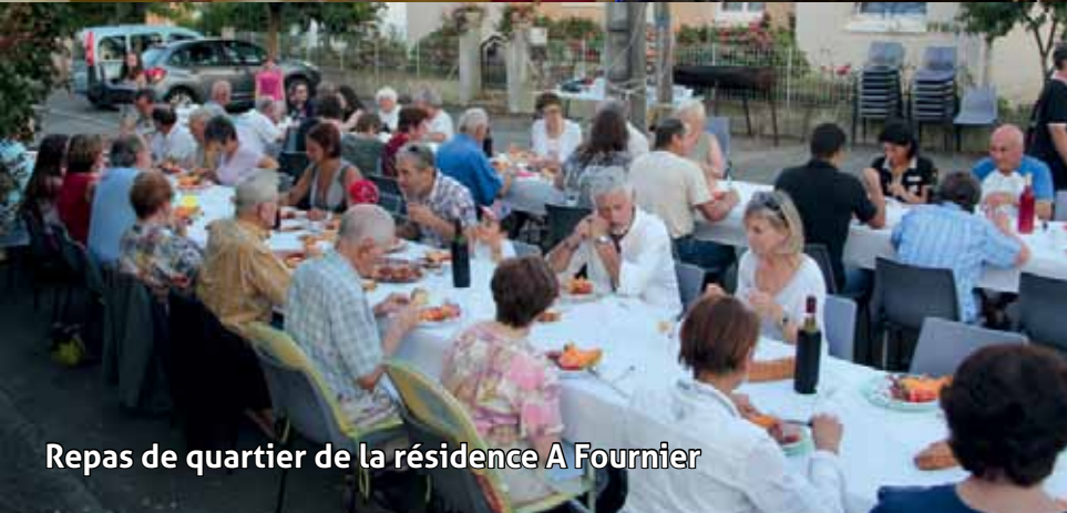
Repas de quartier de la résidence A Fournier