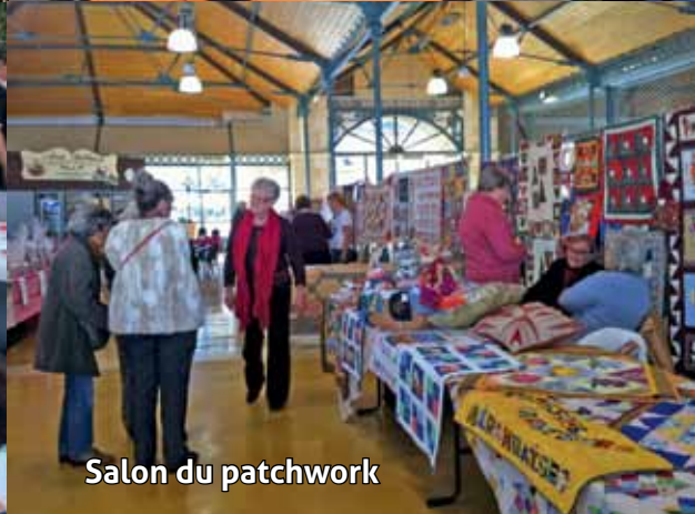
Salon du patchwork