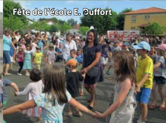
Fête de l'école E. Duffort