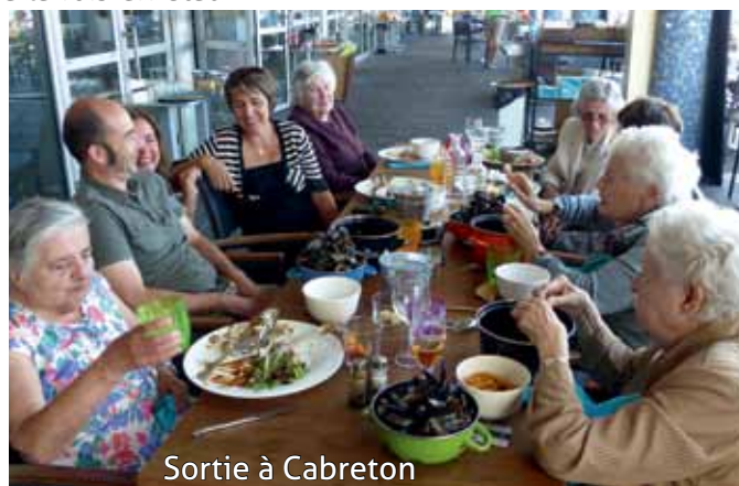
Sortie à Cabreton