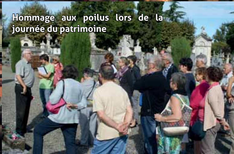
Hommage aux poilus lors de la journée du patrimoine