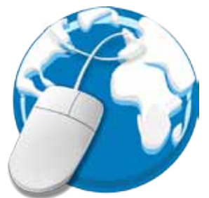
Le nouveau Site Internet p7