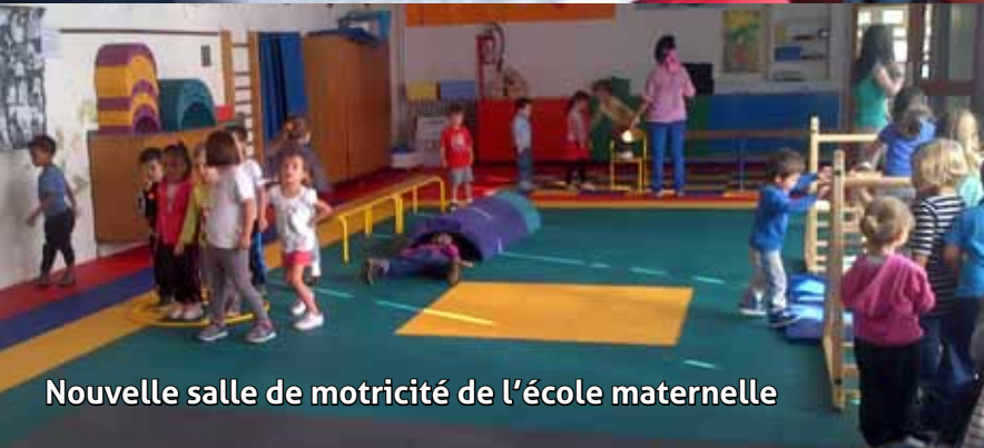
Nouvelle salle de motricité de l'école maternelle