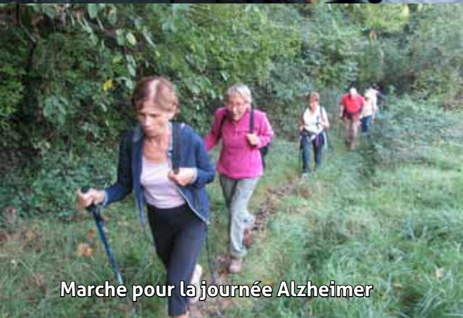
Marche pour la journée Alzheimer