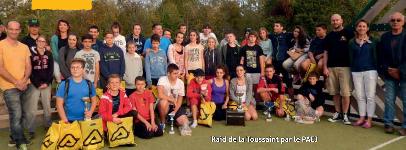
Raid de la Toussaint par le PAEJ