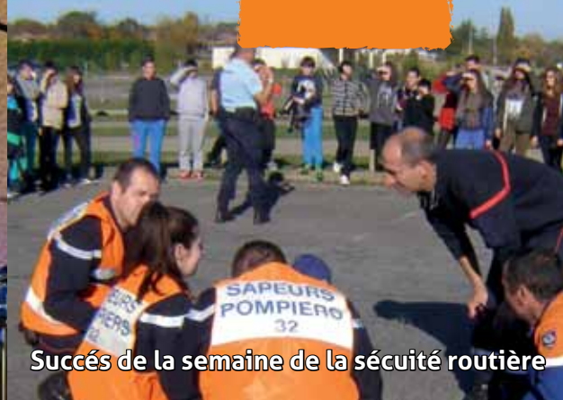
Succès de la semaine de la sécurité routière