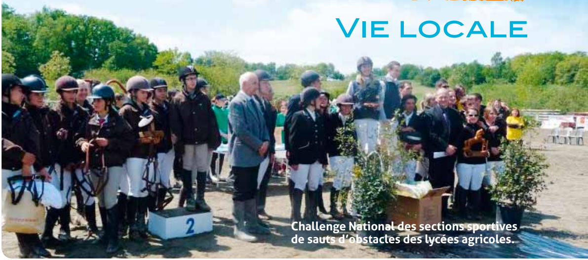
Challenge National des sections sportives de sauts d'obstacles des lycées agricoles.

Durant ces quarante années, l'établissement n'a pas cessé d'évoluer. L'enseignement concentré sur l'agriculture et l'élevage bovin et porcin s'est ouvert au machinisme en