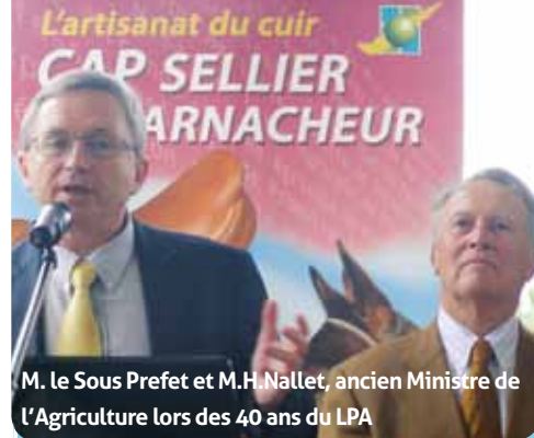
M. Le Sous Préfet et M.H Nallet, ancien Ministre de l'Agriculture lors des 40 ans du LPA