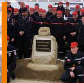
Pose de la 1 ère pierre de la future Caserne des Pompiers