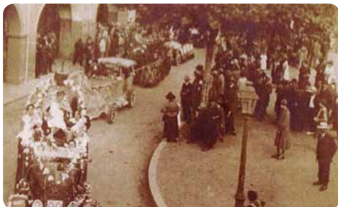
Défilé organisé par l'USAM en 1926. Le char de la Reine parade en tête de cortège sur la Place d'Astarac.

Les fêtes étaient «bon enfant», sans prétention et très joyeuses!.