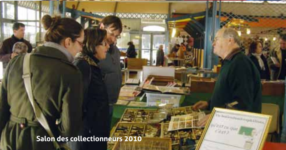
Salon des collectionneurs 2010