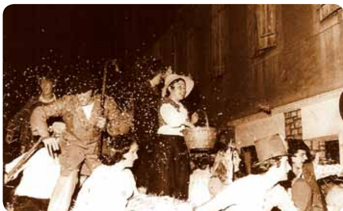
1973 : la jeunesse mirandaise s'amuse à mélanger les genres, paysans et dandy voisinent sur ce char.