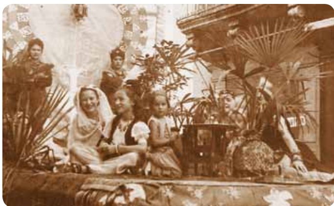
Le char «1001 nuits» apporte un peu d'exotisme en 1947