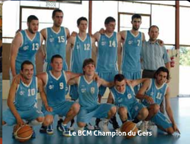
Le BCM Champion du Gers