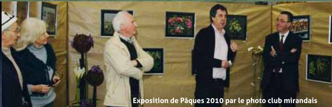
Exposition de Pâques 2010 par le photo club mirandais