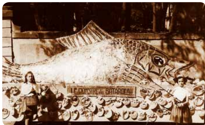
«Le monstre du Batardeau» représente dignement la Société de Pêche en 1947