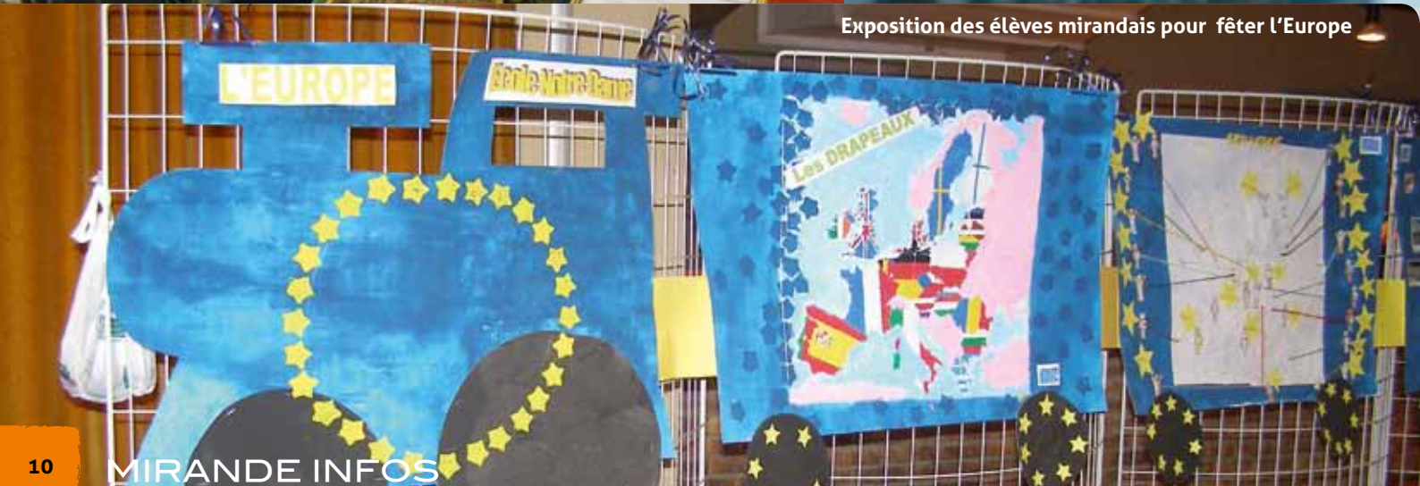
Exposition des élèves mirandais pour fêter l'Europe