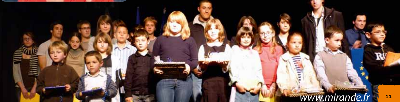
Fête de l'Europe, les élèves méritants