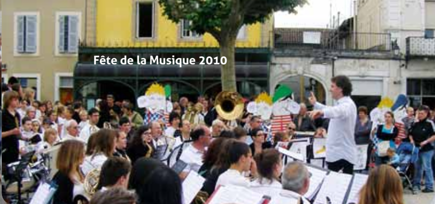
Fête de la Musique 2010