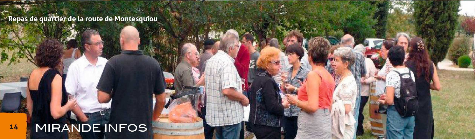
Repas de quartier de la route de Montesquiou