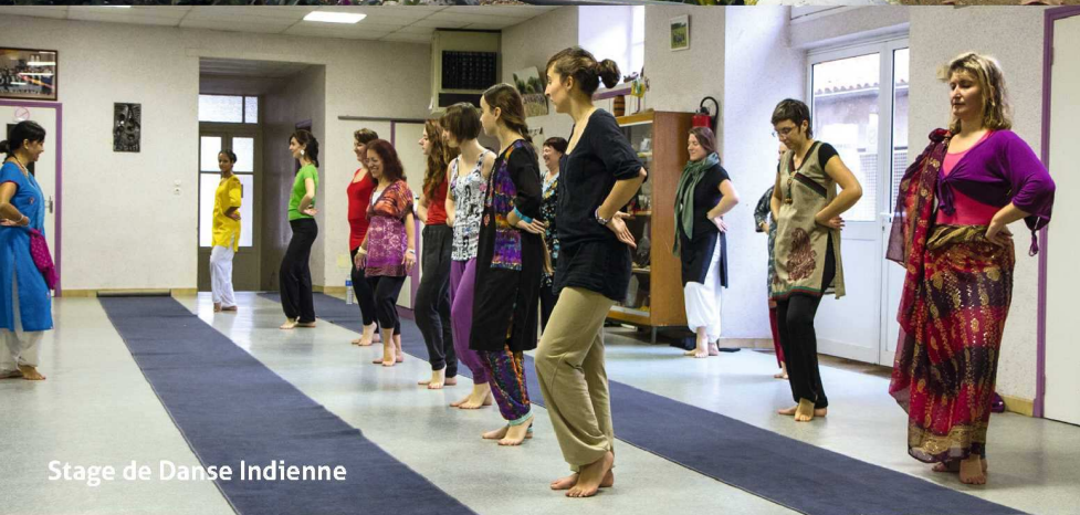
Stage de Danse Indienne