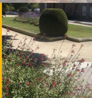
Villes et villages Fleuris Mirande doublement primée p11