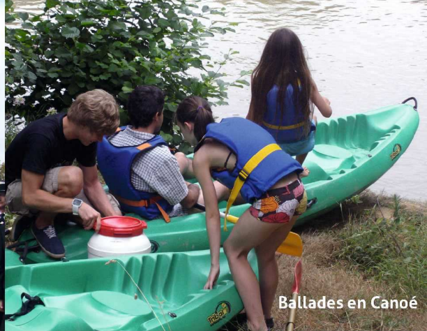
Ballades en Canoë