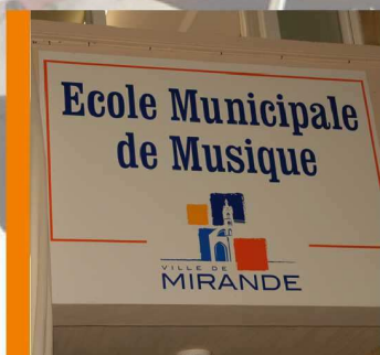
DOSSIER : Musique à Mirande p7