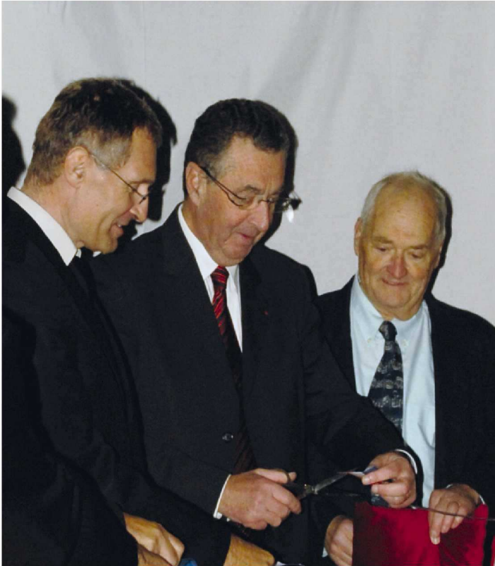
Inauguration de l'École de Musique - 10 novembre