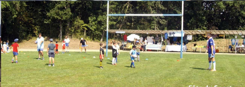
Fête du Sport