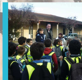
Prévention routière, la ville récompensée p13