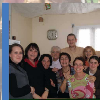
Du nouveau du côté du CCAS p12