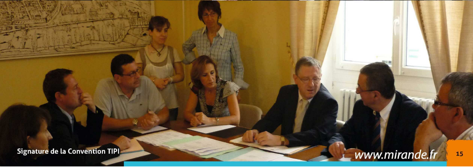
Signature de la Convention TIPI