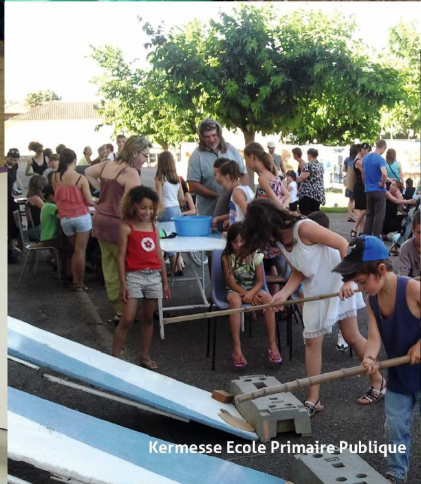
Kermesse Ecole Primaire Publique