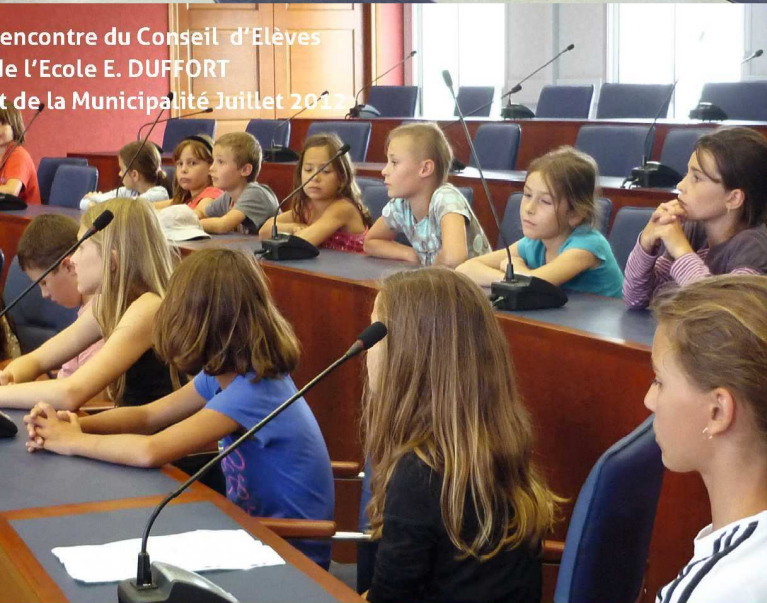
Rencontre du Conseil d'Elèves de l'Ecole E. DUFFORT et de la Municipalité Juillet 2017