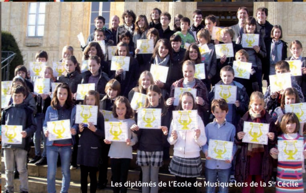
Les diplômés de l'Ecole de Musique lors de la 5 te Cécile