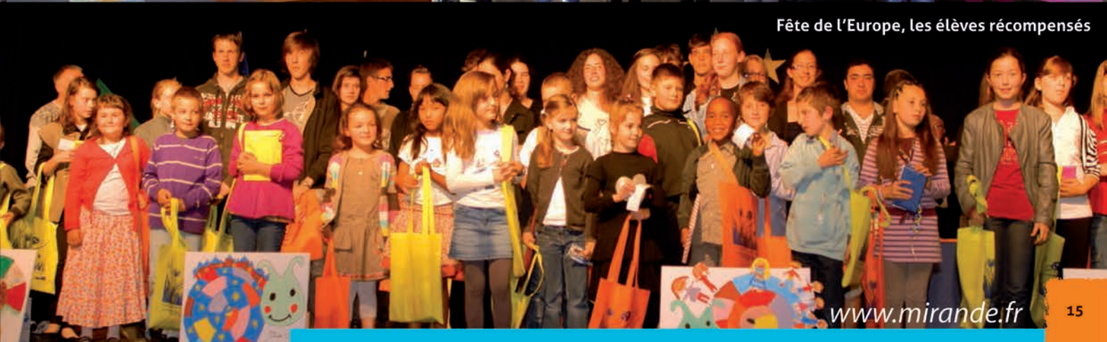
Fête de l'Europe, les élèves récompensés