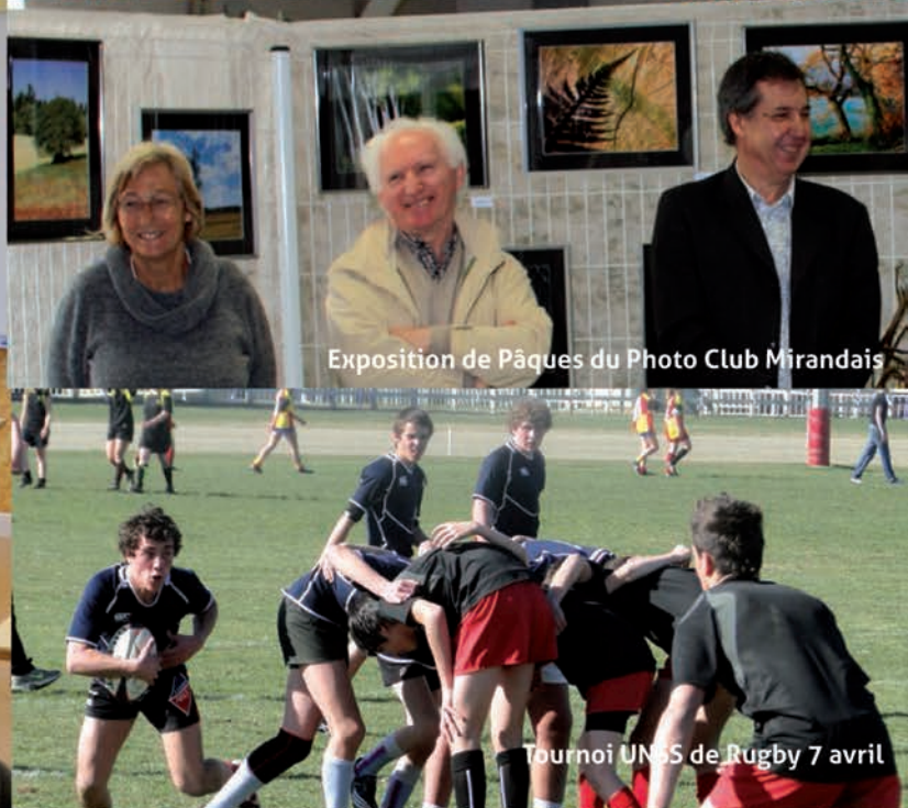
Exposition de Pâques du Photo Club Mirandais