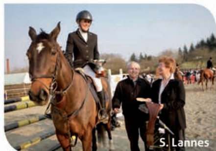
Le grand prix de Mirande, lors du 1 er Concours de Saut d'Obstacles des Ecuries de l'Astarac (3 mars)