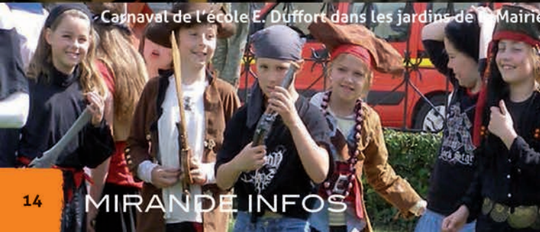
Carnaval de l'école E. Durfort dans les jardins de la Mairie