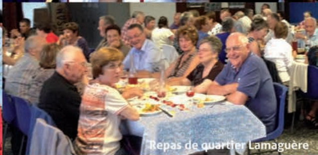
Repas de quartier Lamaguère