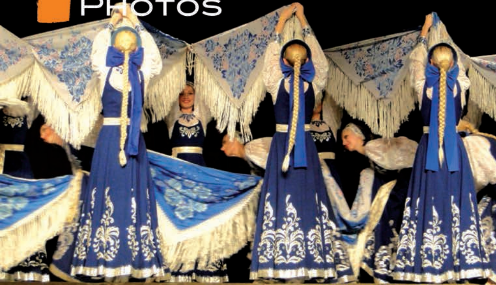
Ballet National de Sibérie - 3 mai