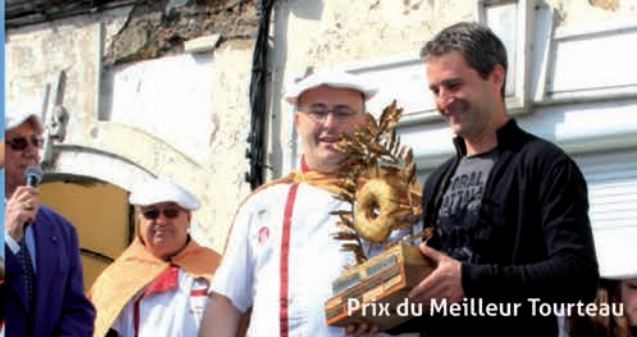
Prix du Meilleur Tourteau