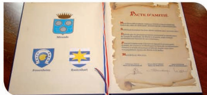
Pacte d'amitié signé le 20 mai à Mirande