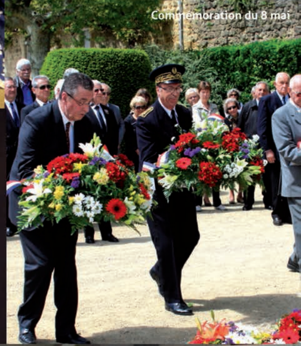
Commemoration du 8 mai