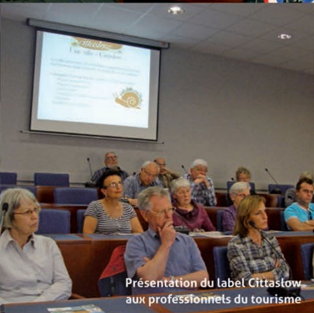
Présentation du label Cittaslow aux professionnels du tourisme