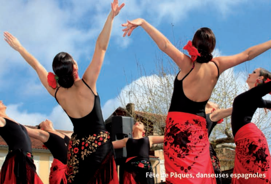
Fête de Pâques, danseuses espagnoles