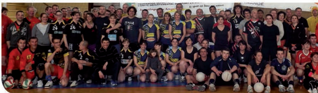
Le critérium national de volley organisé par la Fédération Gersoise des Foyers Ruraux les 26 et 27 mai a réuni 200 participants venus de toute la France. La proximité des deux gymnases fait de Mirande une plateforme d'accueil unique très appréciée par l'organisation et les sportifs.