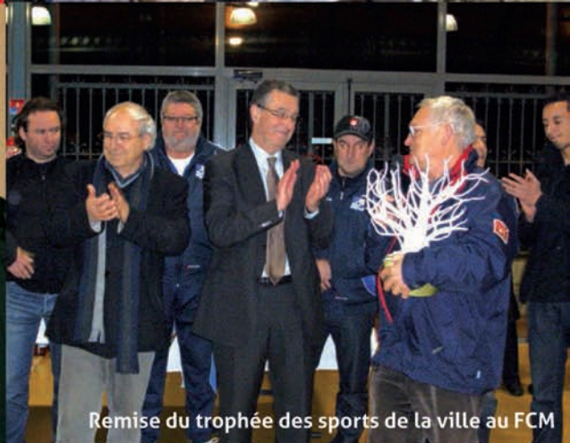
Remise du trophée des sports de la ville au FCM