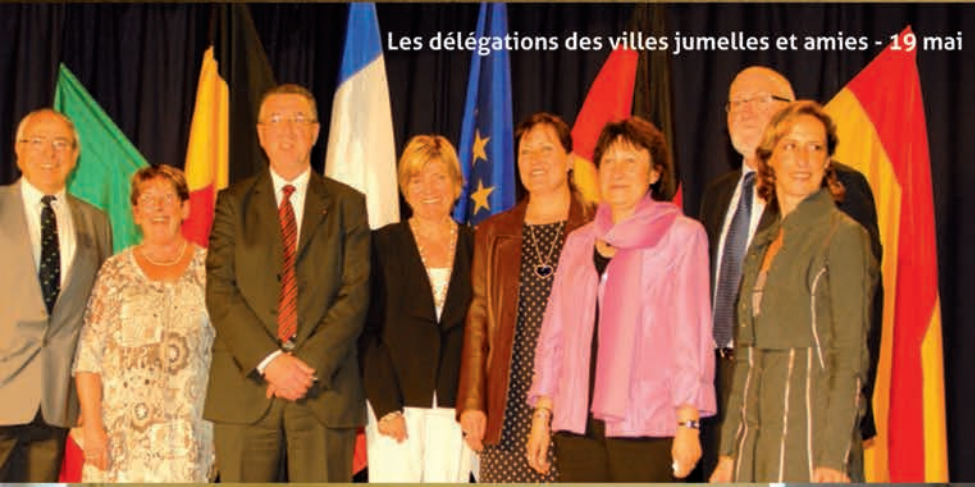
Les délégations des villes jumelles et amies - 19 mai