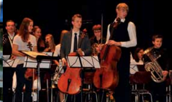
Concert à Korntal