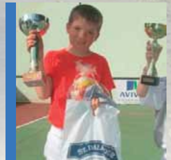
Des résultats chez nos sportifs mirandais p 21