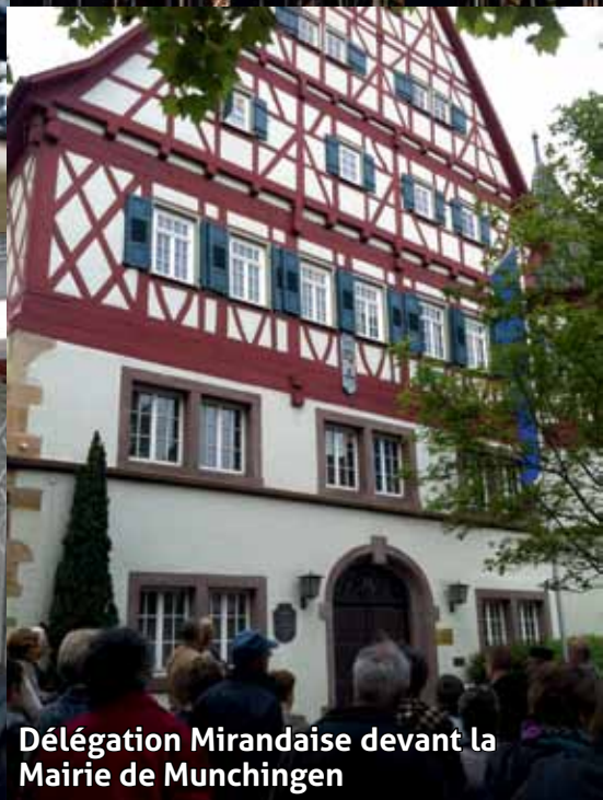
Délégation Mirandaise devant la Mairie de Munchingen