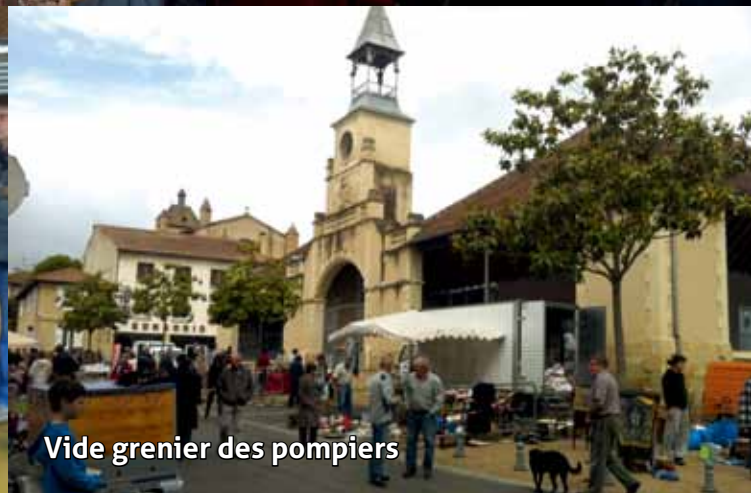
Vide grenier des pompiers