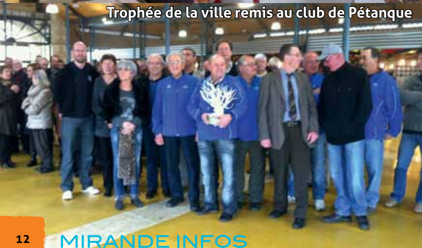
Trophée de la ville remis au club de Pétanque