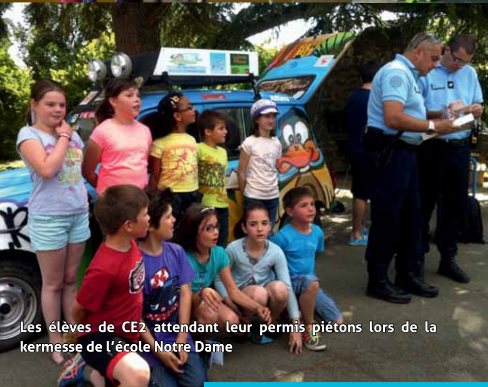
Les élèves de CE2 attendant leur permis piétons lors de la kermesse de l'école Notre Dame