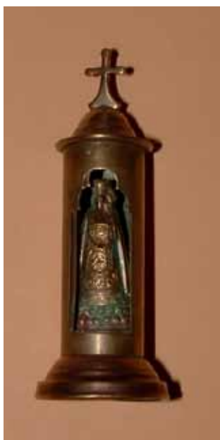
Statuette religieuse de poche d'un Poilu (origine mirandaise)

En cette année de commémoration officielle du centenaire de la Grande Guerre, « Le Renouveau de la Bastide », avec le soutien de la municipalité, ne pouvait que s'associer à cet impérieux devoir de mémoire.