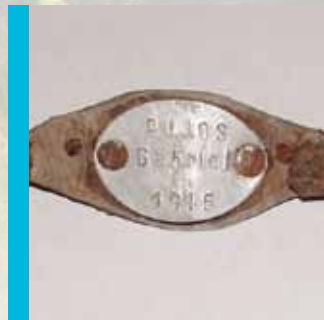
Témoins de la Grande Guerre p 7