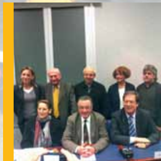
La Nouvelle Municipalité p 8