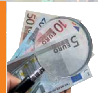
DOSSIER : Les Finances p 10