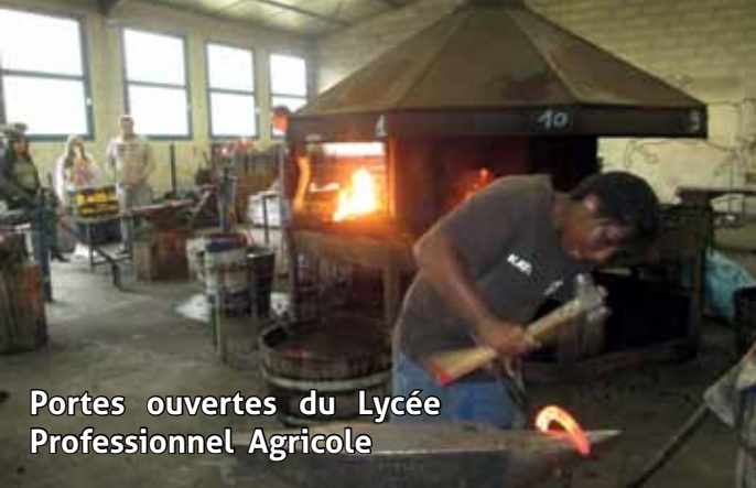
Portes ouvertes du Lycée Professionnel Agricole