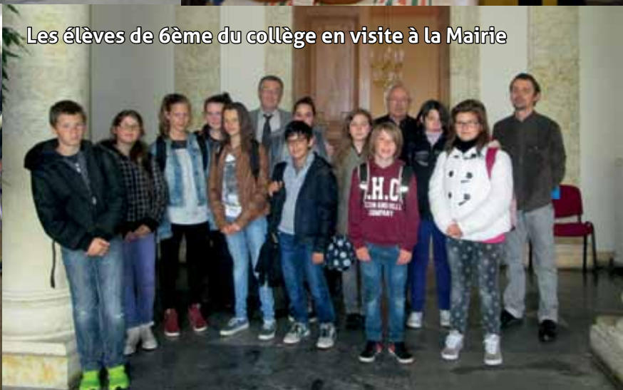
Les élèves de 6ème du collège en visite à la Mairie