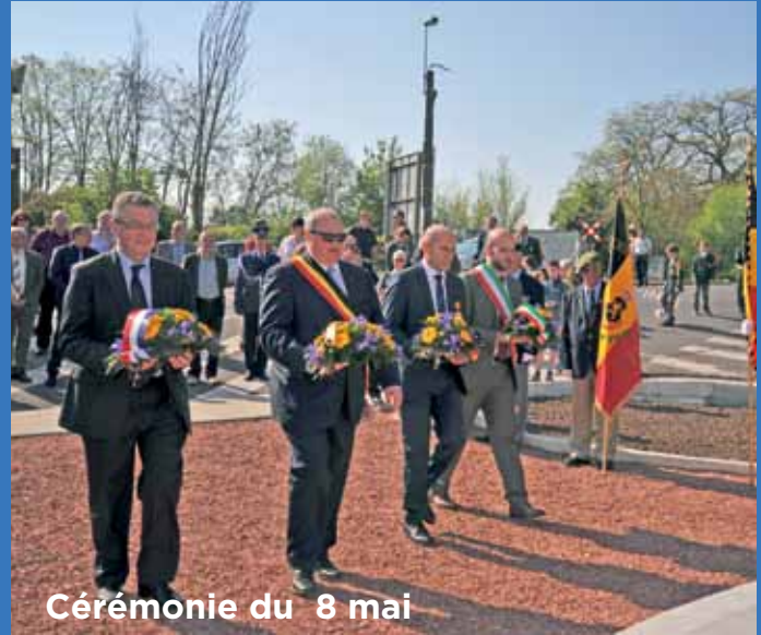
Cérémonie du 8 mai