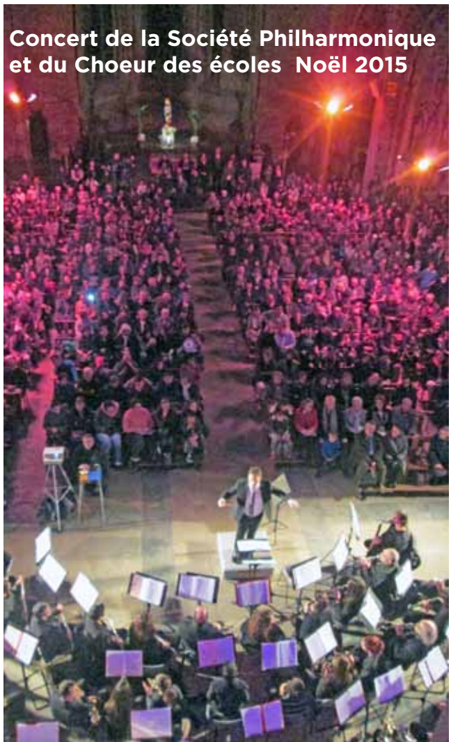
Concert de la Société Philharmonique et du Choeur des écoles Noël 2015