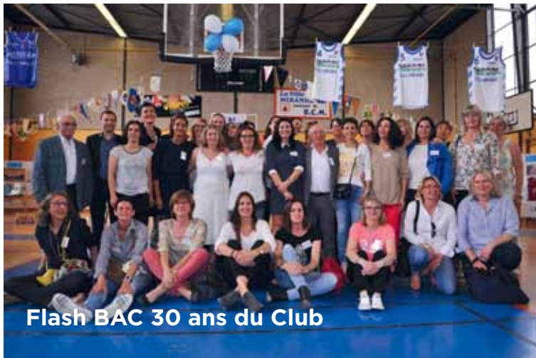
Flash BAC 30 ans du Club