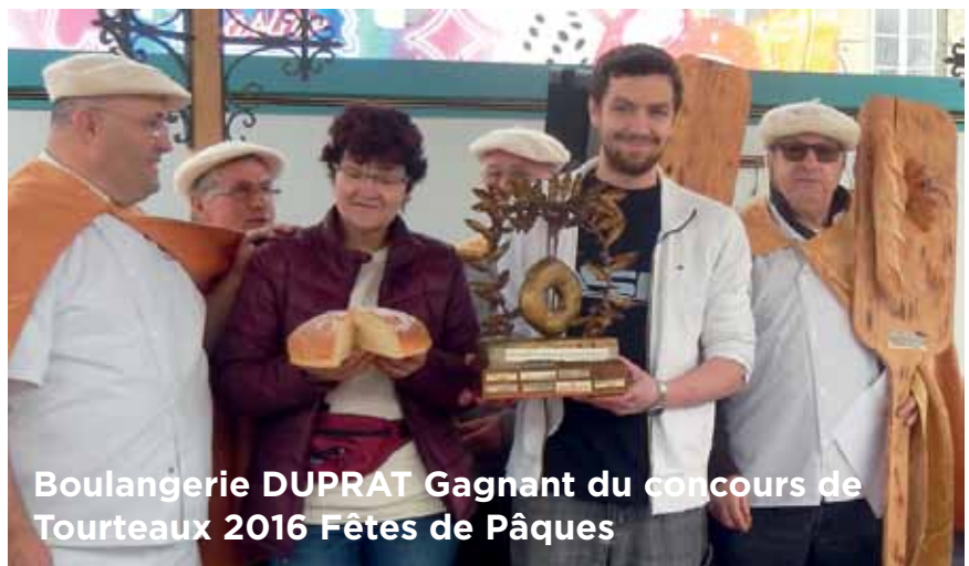
Boulangerie DUPRAT Gagnant du concours de Tourteaux 2016 Fêtes de Pâques