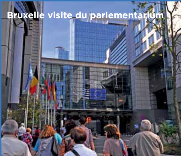
Bruxelle visite du parlementarium