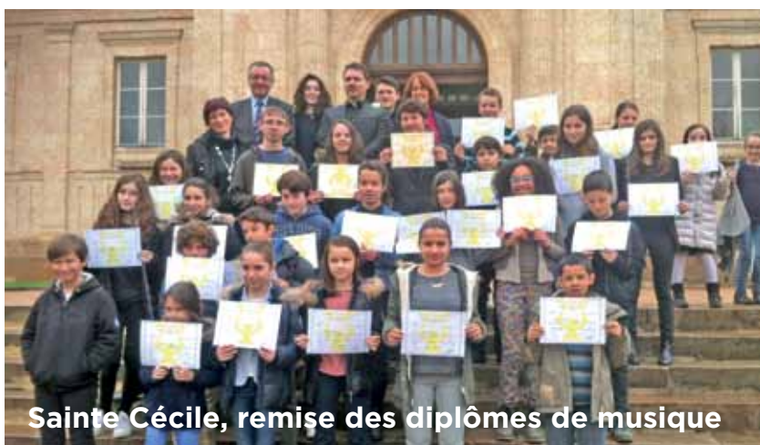
Sainte Cécile, remise des diplômes de musique