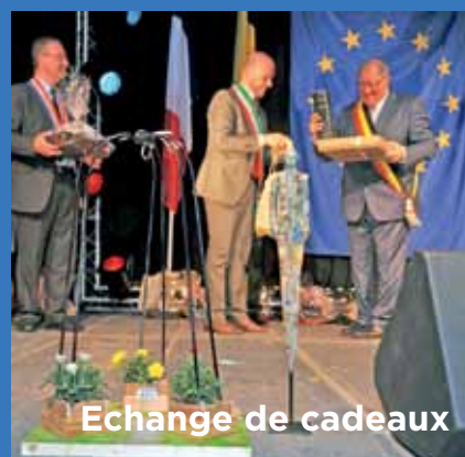
Echange de cadeaux