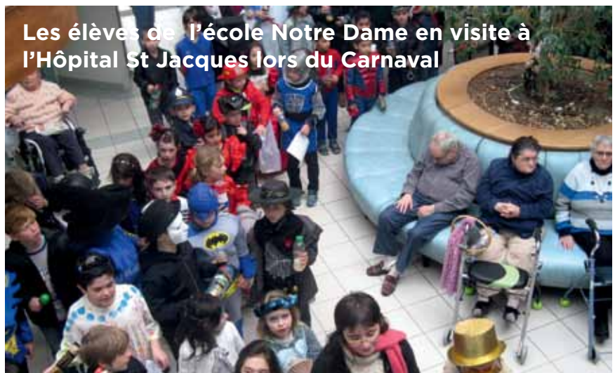
Les élèves de l'école Notre Dame en visite à l'Hôpital St Jacques lors du Carnaval