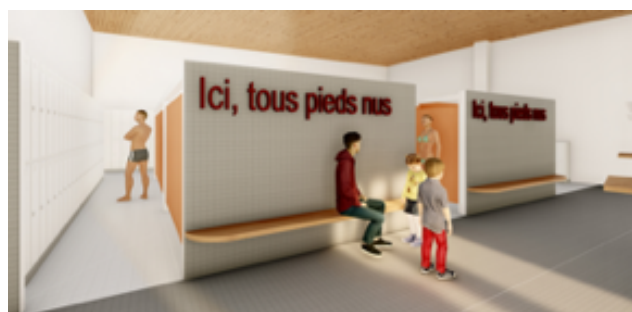
Réfection complète des vestiaires publics