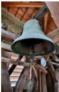
← Cloche Catherine classée