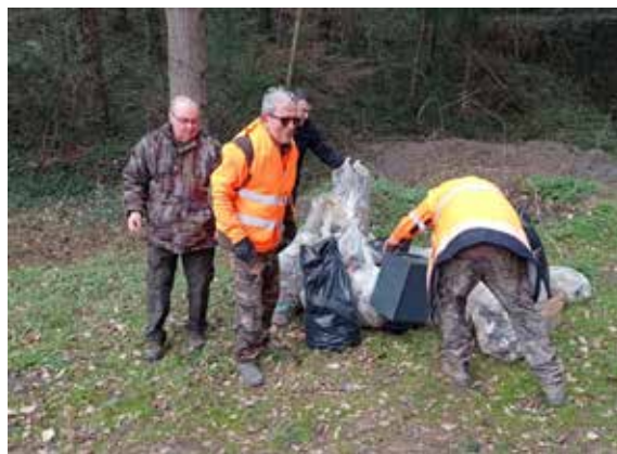
Encore une belle récolte de déchets

Après avoir récupéré gants et sacs poubelles, un bon groupe plein de bonne volonté a parcouru les chemins chagnotaires, les fossés le long de la route, les bords de la Durèze et comme toujours quelques décharges sauvages