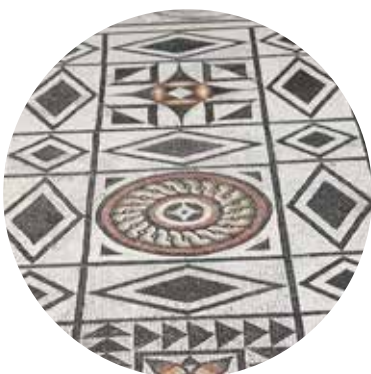
←-- La mosaïque aux svastikas (symbole religieux, croix aux branches coudées)