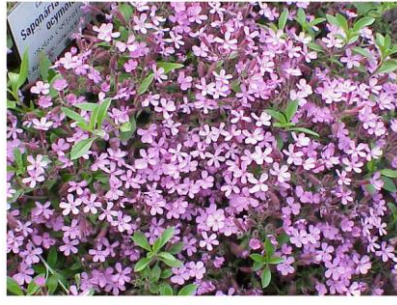
SAPONAIRE DE MONTPELLIER