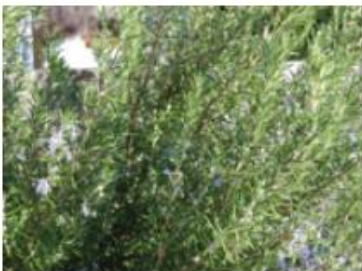
Romarin (Pieds et pots)