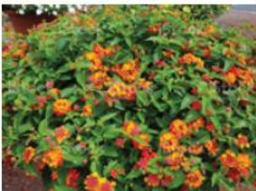
Lantana (Pieds et pots)