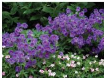
Géranium vivace (Pieds)