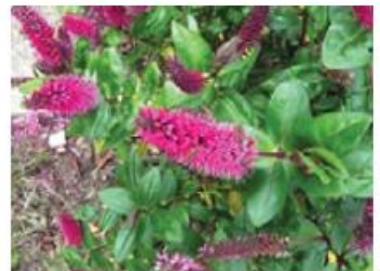
Véronique (Pieds et pots)