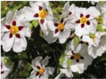
Ciste (Pieds et pots)