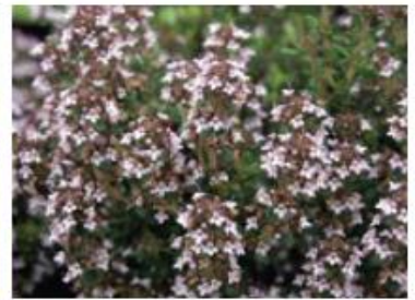
Thym (Pieds et pots)