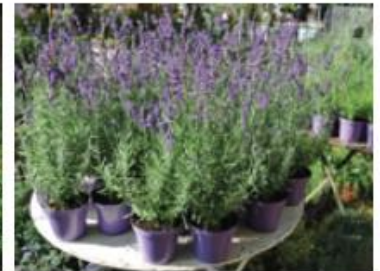
Lavande (Pieds et pots)