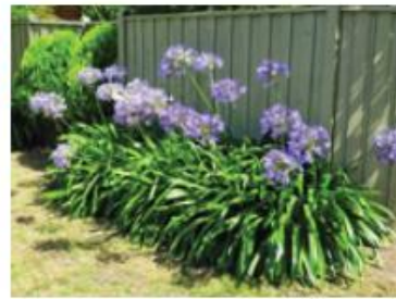
Agapanthe (Pieds et pots)