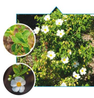
CISTE A FEUILLES DE SAUGE