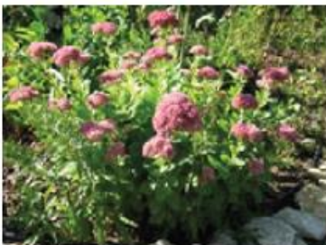
Orpin (Pieds et pots)