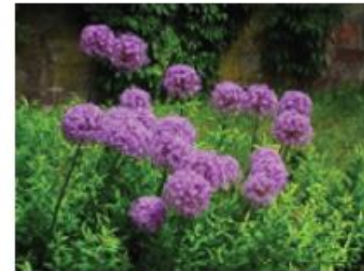
Ail (Pieds et pots)