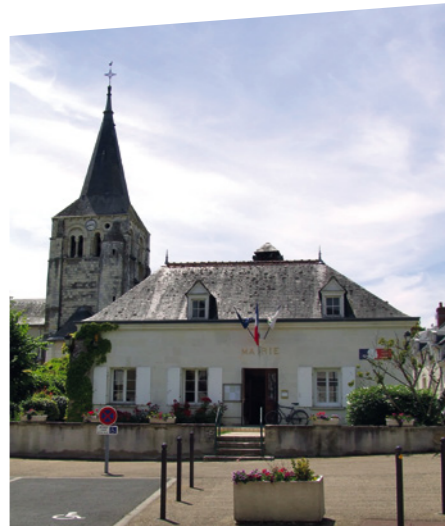
Mairie de Louans.