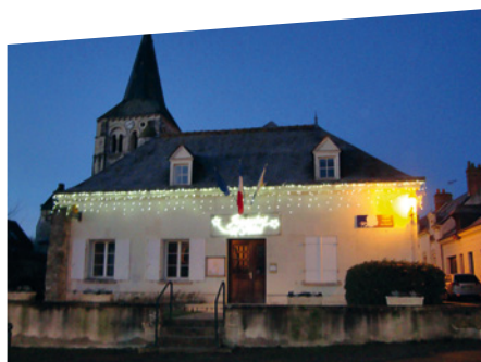
Mairie de Louans