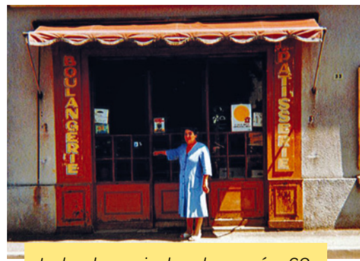
La boulangerie dans les années 60.

LI : baguette, tradition, pain rustaud, pain au maïs, éclairs, babas, tarte tropézienne, brioche, croissants, cookies etc, les louannais n'ont vraiment que l'embaras du choix !