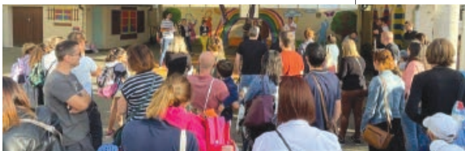
... ET À L'ÉCOLE DE HEIMSBRUNN.

Une belle rentrée ensoleillée pour plus d'une centaine d'enfants de nos deux communes réunies au sein de ce Regroupement Pédagogique Intercommunal garant de la vie de nos deux écoles et par extension garant de la vie dans nos deux villages. E. P. ■