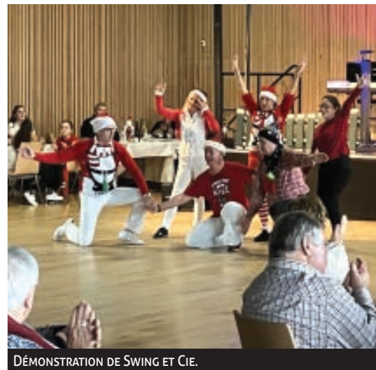
DÉMONSTRATION DE SWING ET CIE.