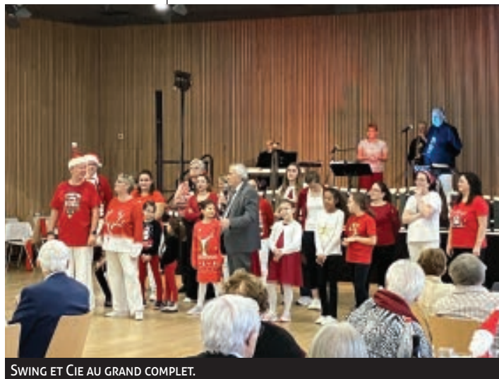
SWING ET CIE AU GRAND COMPLET.