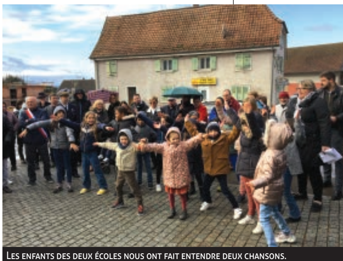
LES ENFANTS DES DEUX ÉCOLES NOUS ONT FAIT ENTENDRE DEUX CHANSONS.

Message de Sébastien Lecornu, ministre des Armées, et Patricia Mirallès, secrétaire d'Etat auprès du ministre des Armées, chargée des Anciens combattants et de la mémoire