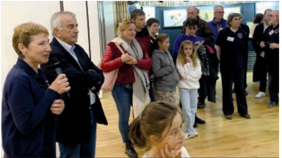
LE DISCOURS DU VERNISSAGE.

La salle de réunion, devenue salle de projections pour l'occasion, a proposé sans interruption les différents reportages des photographes.