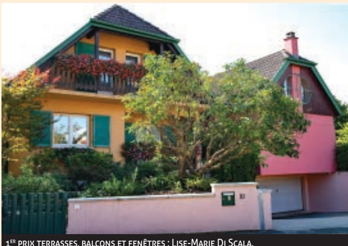
1 ER PRIX TERRASSES, BALCONS ET FENÊTRES : LISE-MARIE DI SCALA.

Les podiums des 2 catégories en lice n'ayant pas la capacité de recevoir tous les candidats méritants à leurs yeux, ils ont souhaité récompenser deux autres habitants inscrits pour leur investissement.