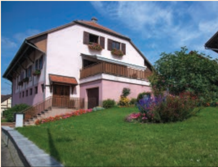
1 ER PRIX MAISONS ET JARDINS : SYLVIA ET JEAN-MARC RUST.

LOIN d'être découragés par les conditions météorologiques peu favorables de ce printemps et de cet été, les participants au concours de fleurissement 2023 ont néanmoins proposé des aménagements et des compositions florales et végétales de grande qualité au point d'embarrasser le jury chargé de les départager. Après avoir parcouru les rues du village par un dimanche matin 13 août des plus radieux, les membres du jury se sont retrouvés en mairie pour délibérer et établir le classement des candidats inscrits. Leurs évaluations ont porté sur les critères suivants : l'harmonie des couleurs, la quantité et la variété des fleurs, l'aspect général et l'entretien des espaces.