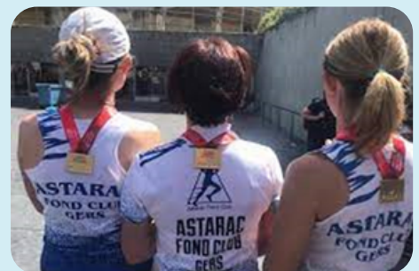
La médaille, bien méritée, à l'arrivée !