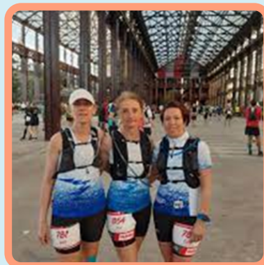
Trois mirandaises prêtes à démarrer