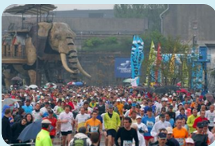
Le grand éléphant de l'île aux Machines était présent comme toujours...