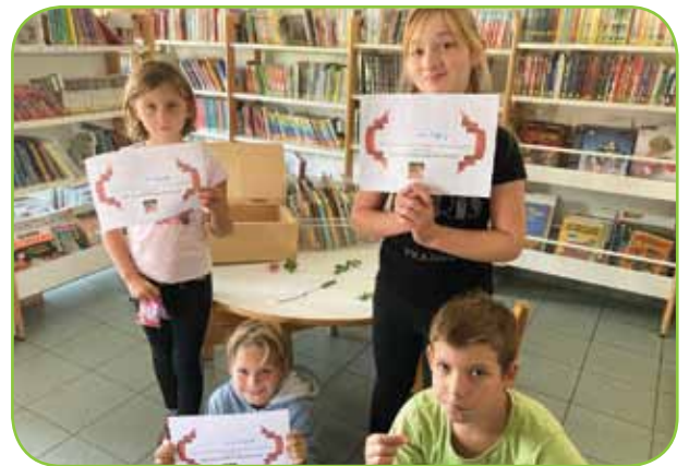
Après l'effort, le réconfort ! À l'issue de cette pré-rentrée ludique, la résolution des épreuves de mathématiques et de français a permis de trouver le trésor et de recevoir un diplôme bien mérité, lors de l'Escape Game.

CONTACT : pour permettre de prendre en charge, dans les meilleures conditions, un nombre d'enfants en nette augmentation, Familles Rurales Cusy a besoin de bénévoles ! Si vous avez envie de partager quelques heures par mois avec des élèves motivés, pétillants et prêts à faire plein d'efforts grâce à votre présence, contactez l'association : afr.cusy@gmail.com