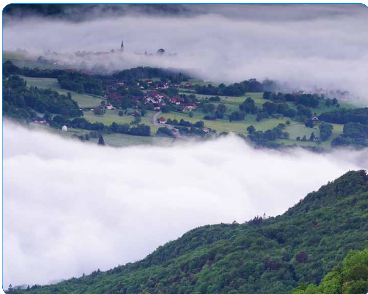
Vue sur Cusy depuis la pointe de Bois Brûlé