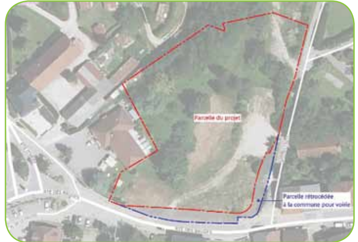
Emprise du terrain du projet de la zone des « trois pins »

Il a été dit, en réunion publique du 25 octobre 2023, que le terrain avait été acheté au prix fixé par les Domaines. Il faut savoir que France Domaine ne donne qu'un avis de prix à titre indicatif et que la commune était alors tout à fait libre de négocier avec le vendeur.