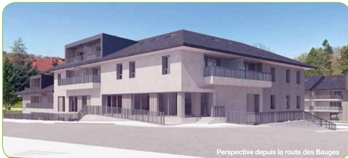
Perspective depuis la route des Bauges

La municipalité actuelle a donc considéré les éléments suivants pour la poursuite du projet :