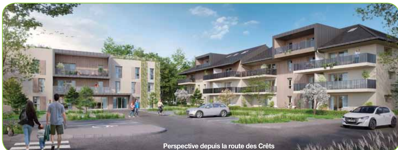
Perspective depuis la route des Crêts