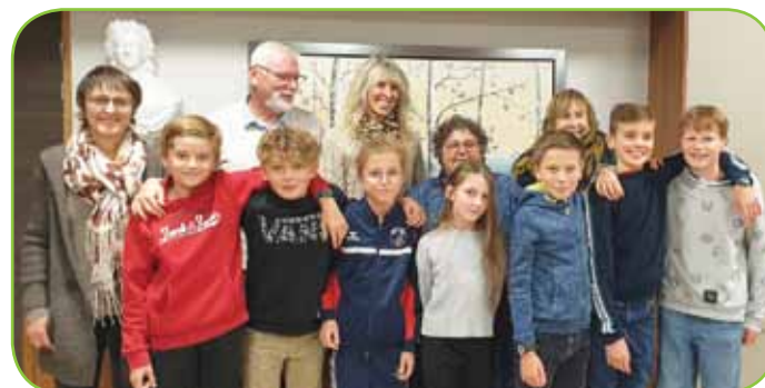
Les jeunes du CMJ encadrés par les élus et bénévoles chargés de les accompagner

concrétiser leurs actions. Le CMJ permet aux jeunes d'aller plus loin dans l'apprentissage de l'autonomie et de la citoyenneté en leur donnant le goût et le sens de l'engagement. C'est un enjeu de notre démarche dans laquelle nous visons à former les futurs écocitoyens à leurs droits et devoirs de demain.