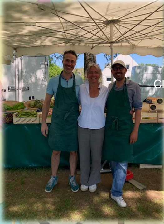
Clap de fin pour le marché