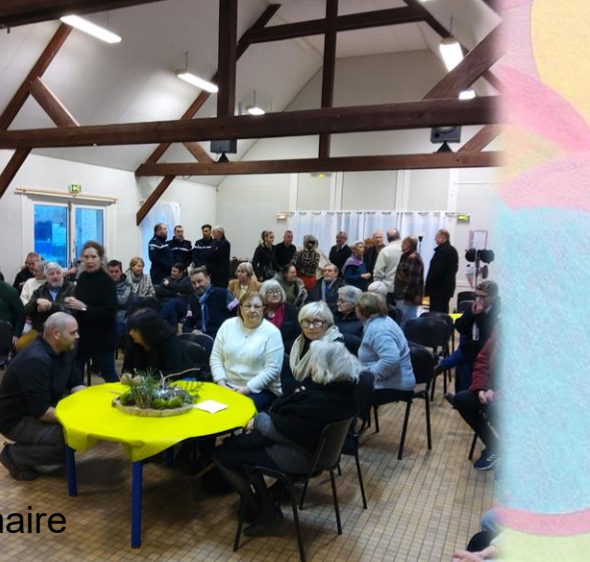
Vœux du maire