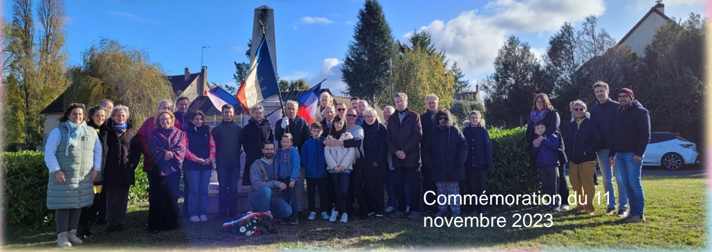
Commémoration du 11 novembre 2023