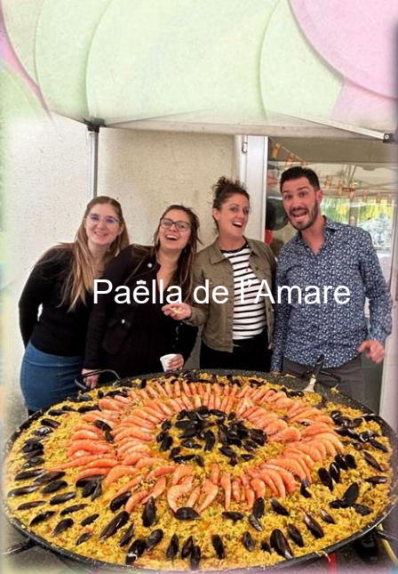
Paëlla de l'Amare