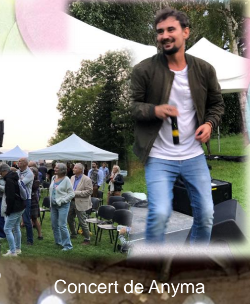
Concert de Anyma