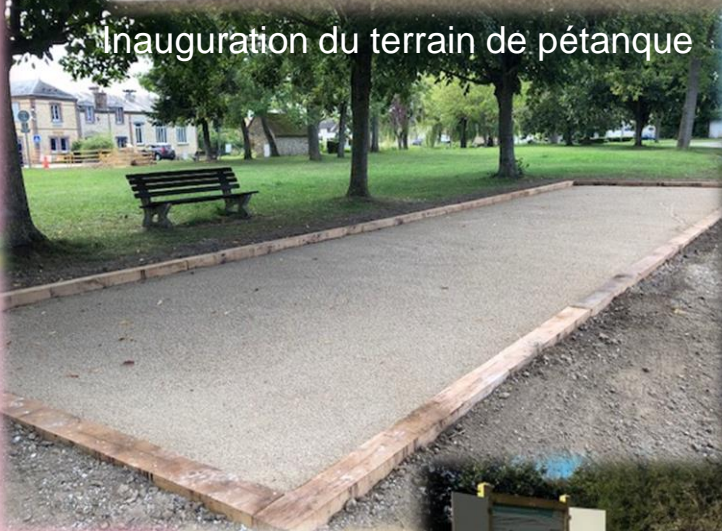
Inauguration du terrain de pétanque