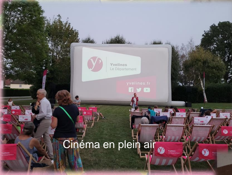
Cinéma en plein air