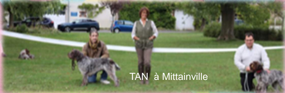
TAN à Mittainville