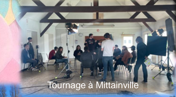
Tournage à Mittainville