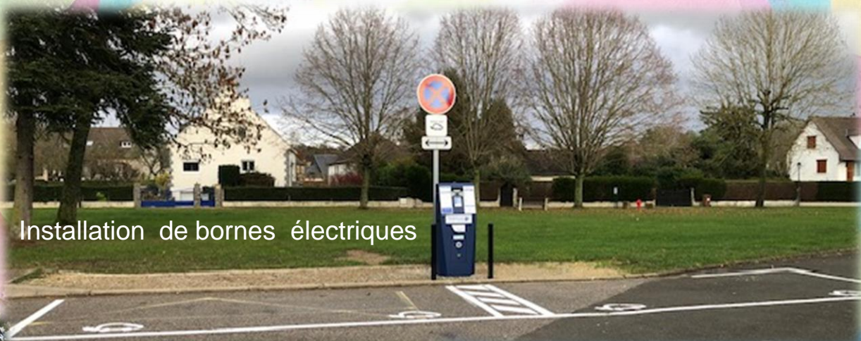
Installation de bornes électriques