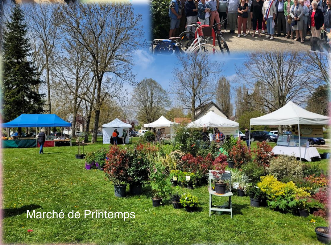
Marché de Printemps