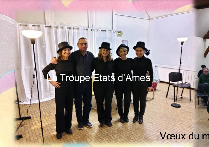
La Troupe États d'Ames