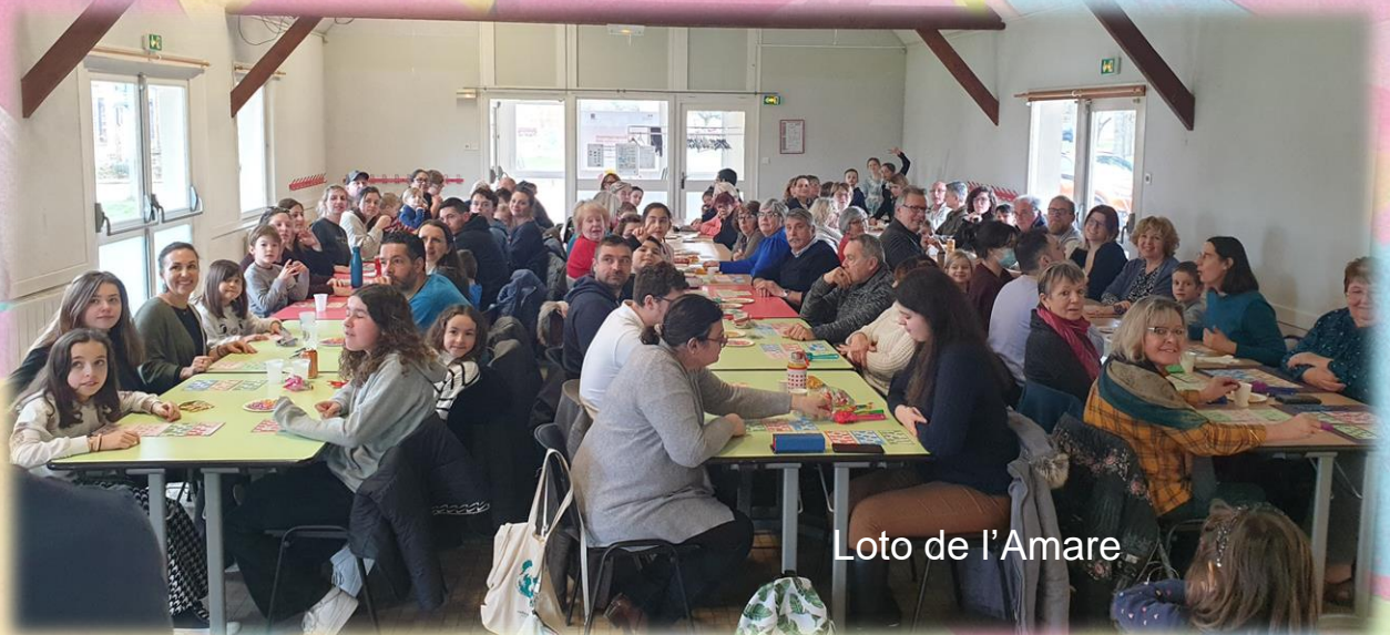
Loto de l'Amare