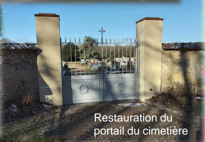
Restauration du portail du cimetière