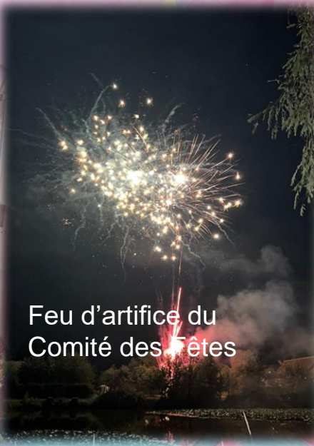
Feu d'artifice du Comité des Fêtes