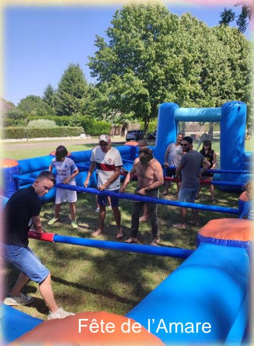
Fête de l'Amare