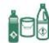
DÉCHETS DIFFUS SPÉCIFIQUES