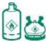
BOUTEILLES DE GAZ