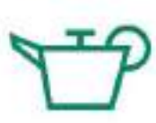
HUILES DE VIDANGE