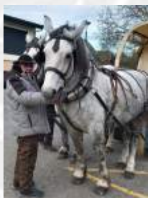
La Feuille de Houx

Les enfants qui n'ont pas eu la chance de rencontrer le Père Noël peuvent venir chercher leur cadeau à la bibliothèque municipale.