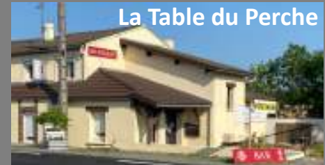
La Table du Perche

Soutenons les entreprises, artisans et commerçants de la commune !