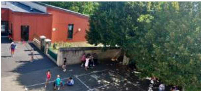
1ère récréation de l'année scolaire