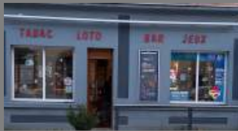
Bar - Tabac - Point Poste Le D'Aligre