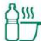
HUILES DE FRITURE