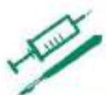
DASRI* DES PARTICULIERS