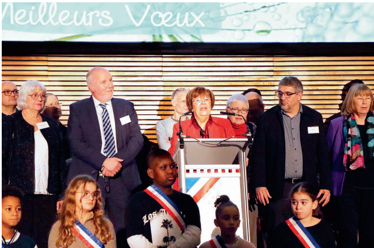
Mme la maire entourée des élus.