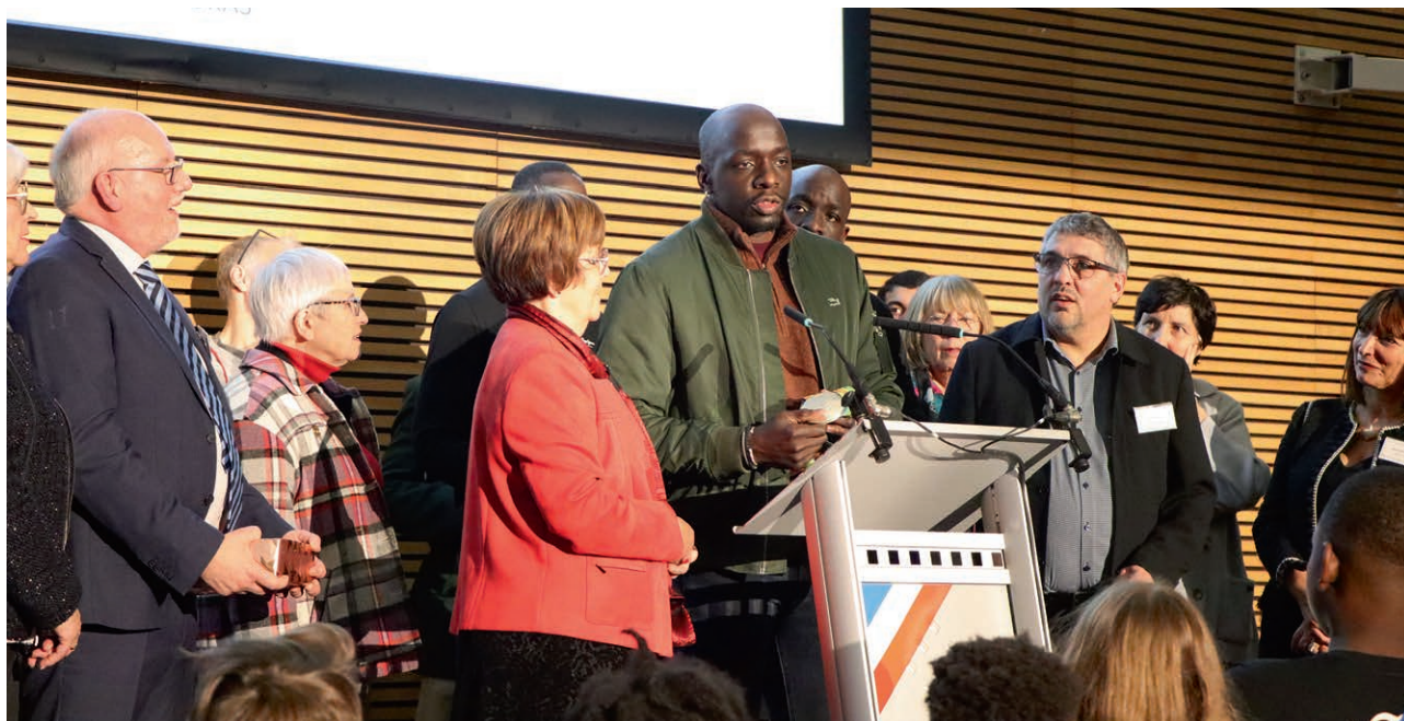
M. NYOKAS champion du monde de handball