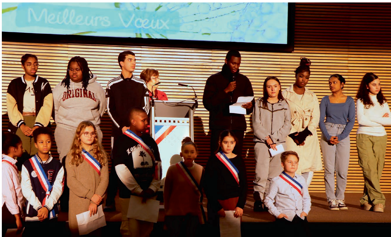
Le Conseil Municipal des Jeunes