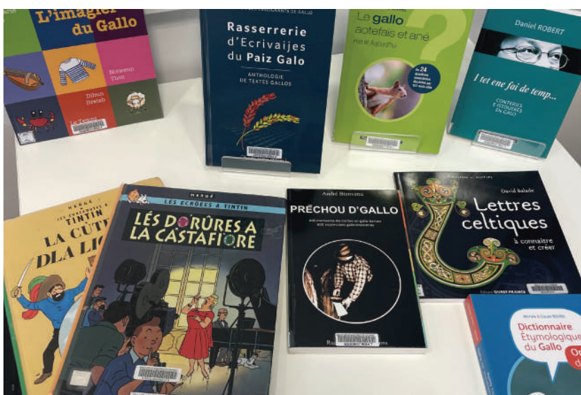
Sélection d'ouvrages en gallo à la médiathèque Parenthèse. 13.09.2023.

Mise en lumière des portraits de gallésants de la commune, issus de la collection De tai a mai proposée par Bretagne Culture Diversité en collaboration avec l'association Chubri. La salle informatique étant aménagée pour l'occasion, les visiteurs ont pu profiter de ces diffusions pour une (re)découverte linguistique tout en confort. Des ouvrages traduits en gallo étaient mis à disposition, pour les petits et grands lecteurs, tels que les Aventures de Tintin ou des contes populaires du pays gallo.