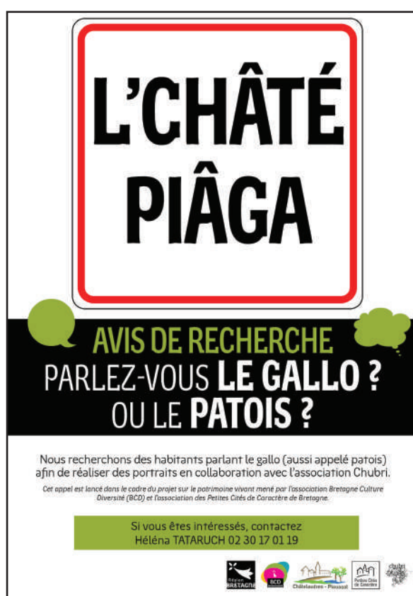
Affiche d'appel aux locuteurs du gallo.

Pour cette deuxième phase, la communication s'est principalement concentrée sur l'appel à galésant·e·s pour la réalisation de portraits vidéo. Le visuel ci-dessous a été diffusé en format papier et digital. En parallèle, un article a été rédigé dans le bulletin municipal.