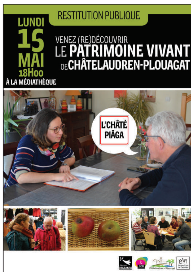
Affiche de la restitution publique à Châtaudren-Plouagat.

Pour cette troisième phase, la communication s'est concentrée sur la restitution publique, une affiche a été conçue afin d'inviter la population à la présentation du bilan du projet.