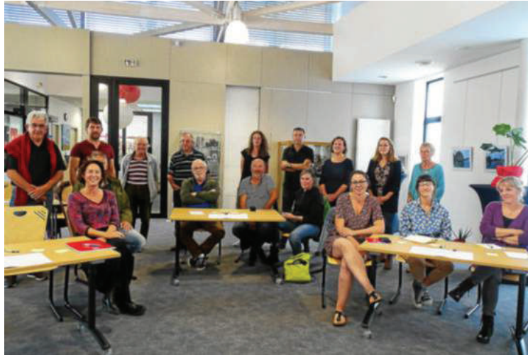
Bretagne culture diversité de Lorient, le réseau des petites cités de caractère, ainsi que les associations communales se sont réunis à l'invitation de la mairie pour s'interroger sur le patrimoine immatériel.

qu'il soit matériel, immatériel, vivant, naturel, industriel... car ils sont interdépendants », a conclu Hélène Tataruch, de l'association BCD.