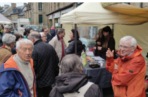
Permanence au marché.