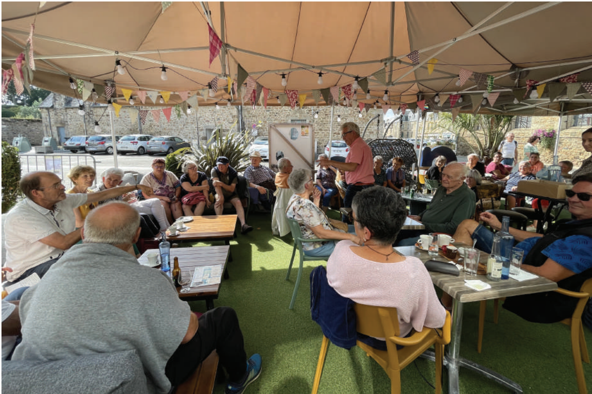
Causerie en gallo organisée au café Chez Georgette dans le cadre des JEP, en partenariat avec Chubri. Une quarantaine de personnes étaient présentes. 2023.09.17.