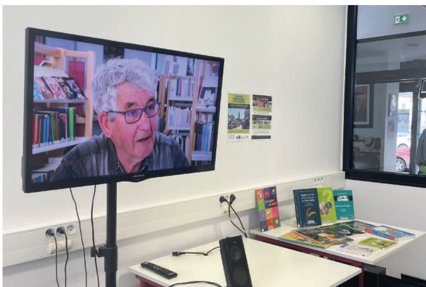
Diffusion des portraits à la médiathèque Parenthèse. 13.09.2023.