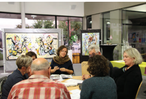
Réunion publique.

Pour répondre à cette nécessaire implication des personnes, nous avons utilisé différents outils :