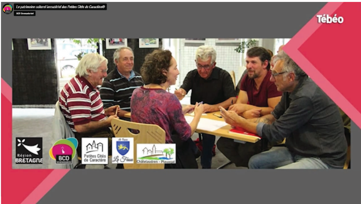
Chronique sur les antennes de Tébéo / Tébésud diffusée le jeudi 9 mars 2023