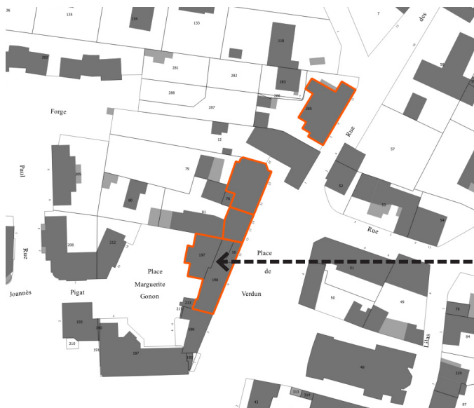
Ancienne épicerie 9 Place Verdun Parcelle : BD 198, BD 197 et BD 16