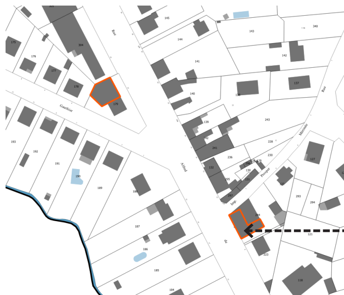
LF Restaurant 10 Rue Alfred de Musset Parcelle : AP 244