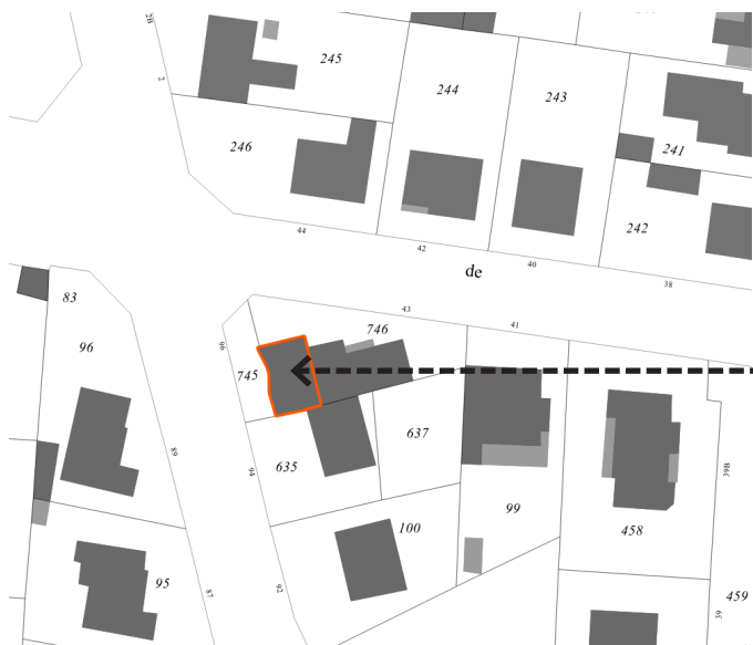
Salon de coiffure « Salon Laurent » 96 Rue Victor Hugo Parcelle : AN 745