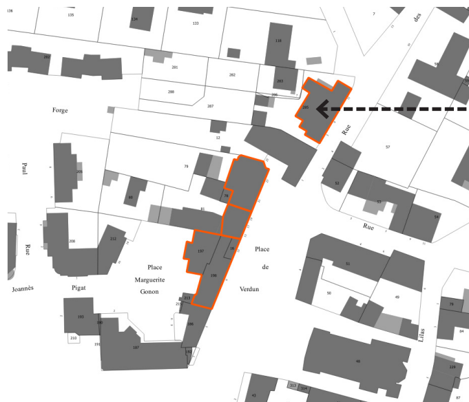
Bar tabac 11 Rue des Muguets Parcelle : BD 285