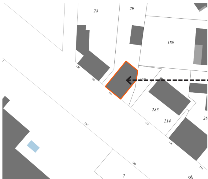
Bar des Tuileries 120 Route de Paris Parcelle : AW 29