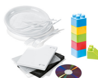
OBJETS EN PLASTIQUE (QUI NE SONT PAS DES EMBALLAGES)