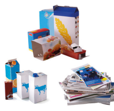
PAPIERS, EMBALLAGES EN CARTON ET BRIQUES ALIMENTAIRES