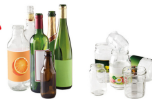
BOUTEILLES, POTS ET BOCAUX EN VERRE