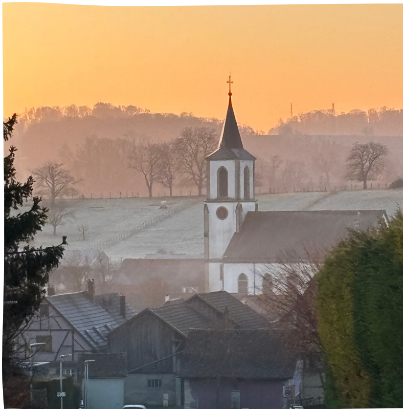
Levé de soleil sous le givre, un matin de janvier...

Au revoir mois de janvier et bonjour mois de février. À peine avons-nous fini de nous souhaiter les meilleurs vœux pour la nouvelle année, de déguster d'excellentes galettes des rois, que nous passons sans transition à la Chandeleur et à ses traditionnelles crêpes. En février, on célèbre aussi les carnivals de Nice, Dunkerque, Venise, Rio... Sans oublier le 14 février, jour de la Saint-Valentin, considéré dans de nombreux pays comme le jour de la fête des amoureux. « La vie est belle, alors on en profite et on lui sourit »