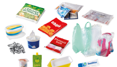
TOUS LES AUTRES EMBALLAGES