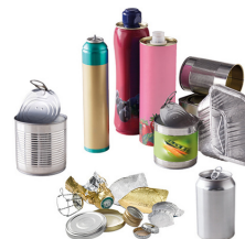
EMBALLAGES EN MÉTAL MÊME LES PETITS