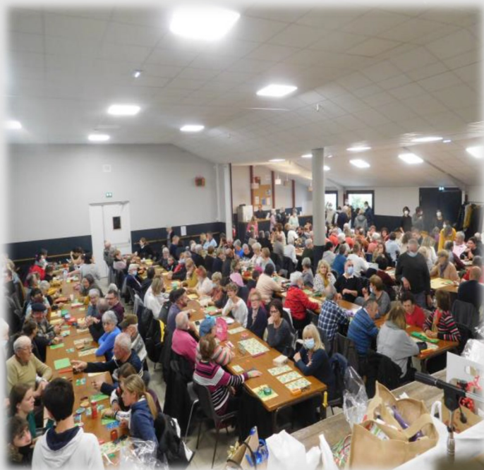
Loto du club