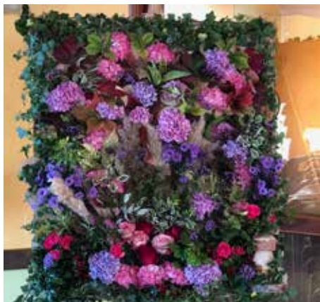
Cette magnifique composition florale a été réalisée par Cyrille Obé et le personnel communal.