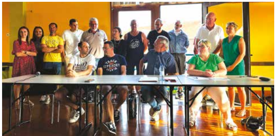
Le bureau de l'US Beauchamps au grand complet.