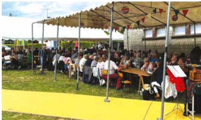
Nouveau succès pour le Repas Républicain