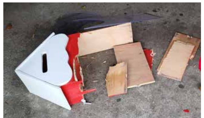
La boîte aux lettres du Père Noël n'a pas résisté à ces actes idiots.

Dans la nuit du 6 au 7 janvier, des individus ont saccagé la maison du Père Noël qui se trouvait sous l'abri-bus, Place du Général Leclerc. Que dire devant de tels actes, les mots nous manquent. S'attaquer au symbole du bonheur et de la joie des enfants reflète le degré d'intelligence des auteurs.