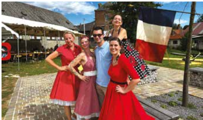
Monsieur le Maire en charmante compagnie