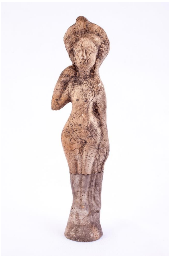
Une Vénus (déesse de l'amour et de la beauté)