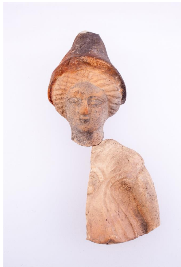
Une Minerve (déesse des sciences, de la guerre et... des maîtres d'école)