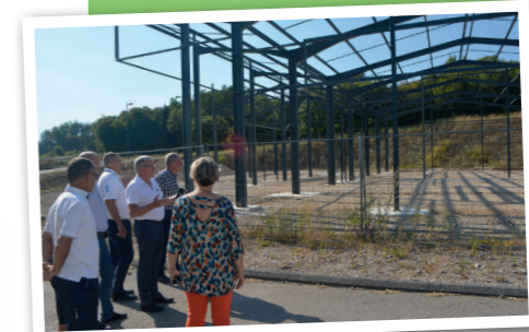
Visite des élus sur la ZAE La Louvière le 24 juillet dernier pour faire le point sur les parcelles disponibles et les projets en cours.

LE TRANSFERT DES Z.A.E. : 6 zones, aujourd'hui propriété des communes, répondent aux critères et seront donc reprises par la C.C.L.L. : Amancey, Arc-et-Senans, Chantrans, Cléron, Épeugney et Fertans. Les conditions de ce transfert sont en cours de négociation.