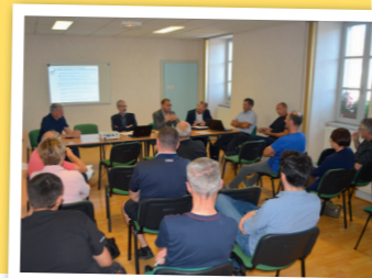
Réunion d'information sur le très haut débit

Des services aux habitants pour l'emploi : Voir rubrique « Des services à votre écoute » > Page 4