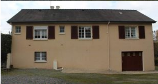
Exemple de photos à joindre

Ce document permet d'apprécier la situation du projet par rapport aux constructions avoisinantes et au paysage.