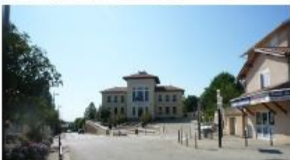
Exemple de photos

DP7 permet de situer le terrain dans l'environnement proche.