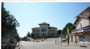
Exemple de photos

DP7 permet de situer le terrain dans l'environnement proche.