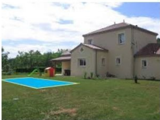
Exemple de photo à joindre

Ce document permet d'apprécier la situation du projet par rapport aux constructions avoisinantes et au paysage.