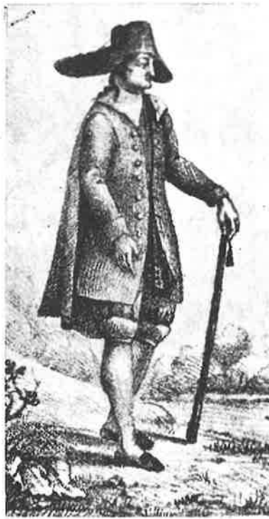
Paysan d'Uchizy au mariage de sa fille