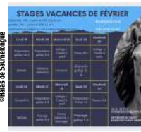
@Heras de Saumelongue