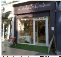
@Atelier des créatrices