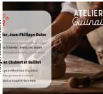
@Nougat Chabert et Guillot