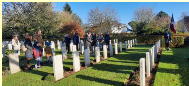
1914-1918 Wailly à ses enfants morts pour la France

Comme chaque année, la France entière rend hommage à ses 2 000 000 de soldats morts durant la Première Guerre mondiale.