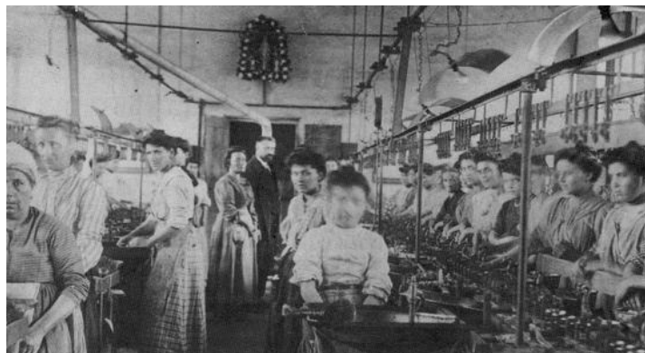
Une filature de soie dans le Var, vers 1890 qui devait ressembler à celle du château de La Touche (appelée souvent à tort la «magnanerie»). Construite vers 1840, elle fonctionna jusque dans les années 1930.

Une dizaine de filles du village travaillaient à surveiller la soie ; Mes sœurs Rose et surtout Camilla ont fait ce travail.