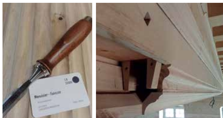
Ambiance studieuse dans l'atelier de L.A. studio... Sous la direction d'Arnaud, Alyosha apprend son métier en alternance. Ci-dessus, détail du plafond du grand salon au château de La Touche