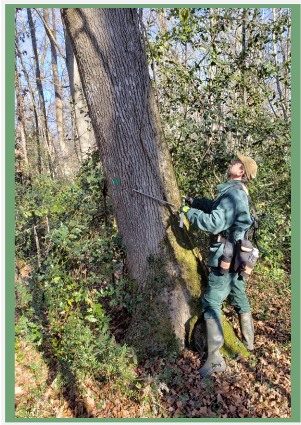
Marquage des arbres par Régis LERMITE Technicien forestier territorial.