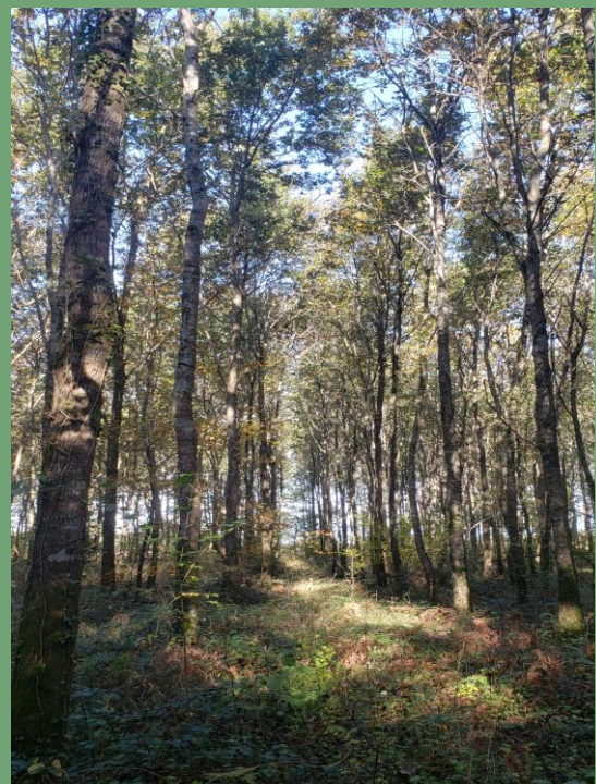
Peuplement trentenaire en régénération naturelle