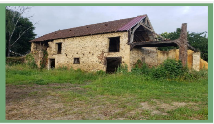
La grange avant les travaux en juin 2023.