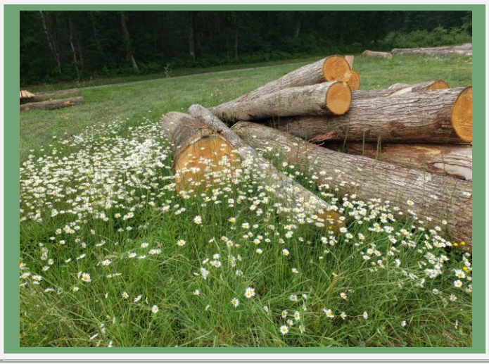
Châtaigniers destinés au bardage des garages.