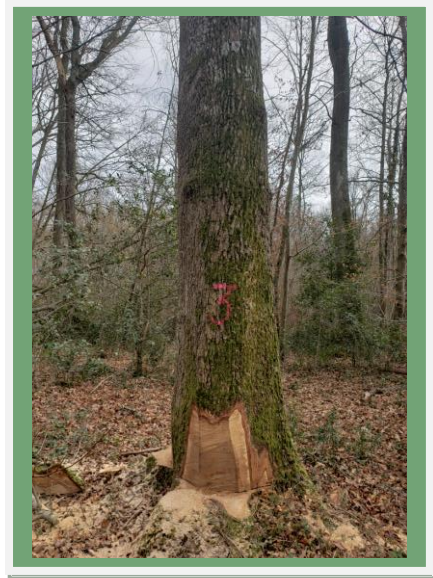
Abattage des chênes.