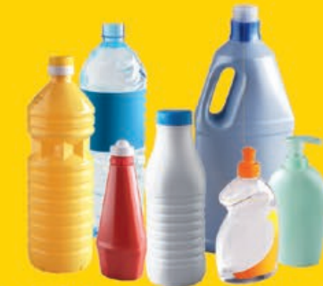
bouteilles / bidons / flacons