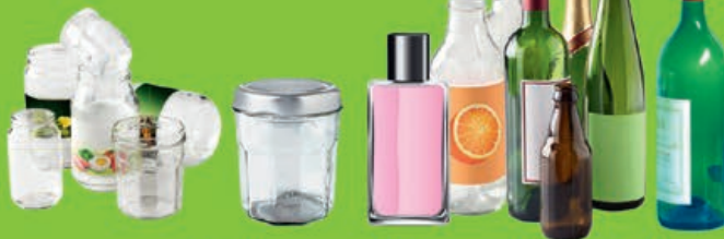
pots / bocaux / flacons / bouteilles