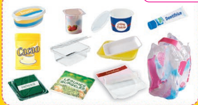
pots / barquettes / boîtes / sachets / films

i Merci de retirer les opercules et les films plastiques des pots (yaourts, crème...) et des barquettes (jambon, viande...)