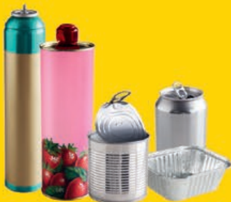
acier / aluminium