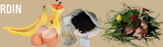
épluchures, coquilles d'œuf, filtres à café, thé, feuilles, fleurs...

i Pour du compostage individuel ou collectif, contactez votre Service Gestion des Déchets