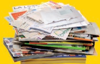
journaux / magazines prospectus / catalogues cahiers / feuilles enveloppes