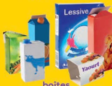
boîtes cartonnettes briques alimentaires