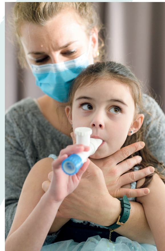
Juillet 2023 - Conception & réalisation CIMAYÀ - Crédits photographiques : Loïc Trujillo