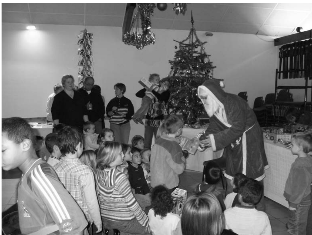
Le Noël des enfants organisé par le comité des fêtes

Aucune autre question n'étant posée, la séance est levée à 00H 10.