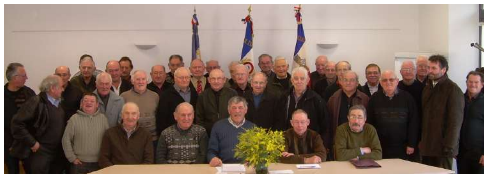
Une assemblée générale anciens combattants

Cette année 2016 s'achève. L'assemblée générale s'est tenue le 30 janvier 2016. Après l'ordre du jour, le tiers sortant