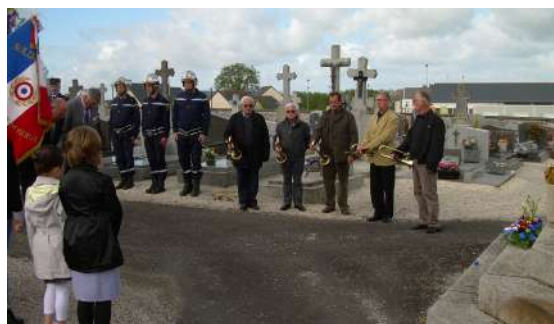
Les musiciens pendant une cérémonie