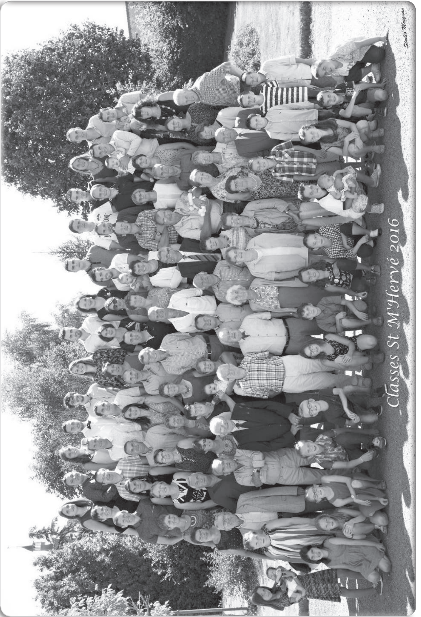
Classes St M'Hervé 2016