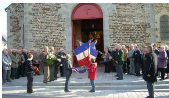
Salut des drapeaux, cérémonie avec la section de Balazé

Le samedi 30 juillet, méchoui des anciens d'Algérie rejoints par les soldats de France, cette manifestation sympathique fait vivre la mémoire et l'amitié des anciens d'Algérie, deux agneaux ont été nécessaires pour le repas.