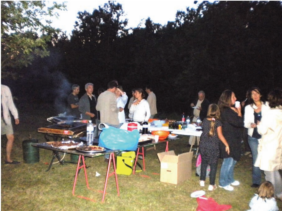
Le repas champêtre du 12 septembre

Suite aux différents dépôts sauvages d'ordures, la décision de maintenir ou non les containers à verre dans le virage de la route de Saint Cyr sera prise lors du prochain conseil municipal.