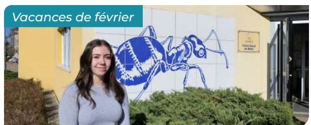
Vacances de février

Le Département a donné le coup d'envoi de 4 mois de travaux sur la RD27 afin de matérialiser des bandes cyclables entre les bâtiments de la CRS 34 et le rond-point des 4 routes. Un aménagement sera fait sur ce dernier afin de sécuriser les pistes en extérieur du giratoire.