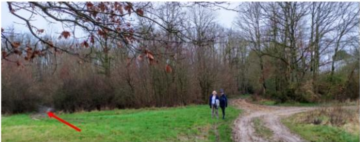
Carrefour du petit champs