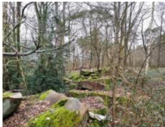
Le bois du Rondeau