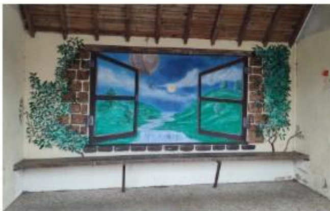
Peinture de J.B Berty