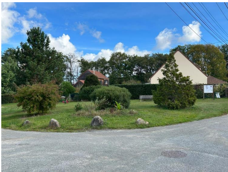
La place du Val