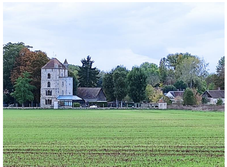
La tour de Saint Lucien