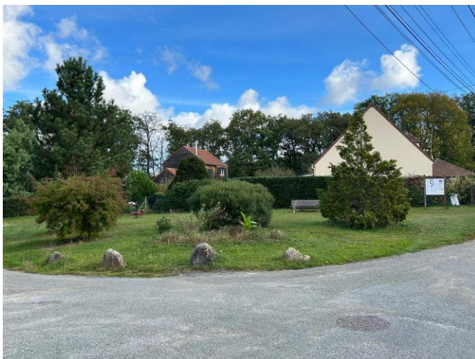
La place du Val