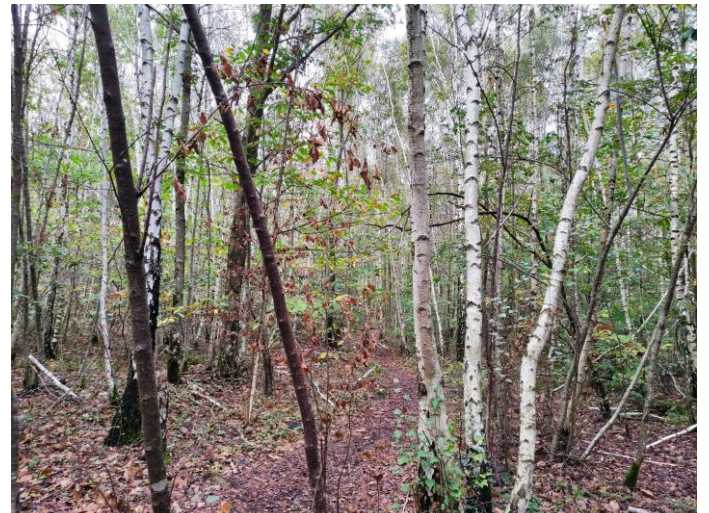
Le petit bois de bouleaux de Montécouvé